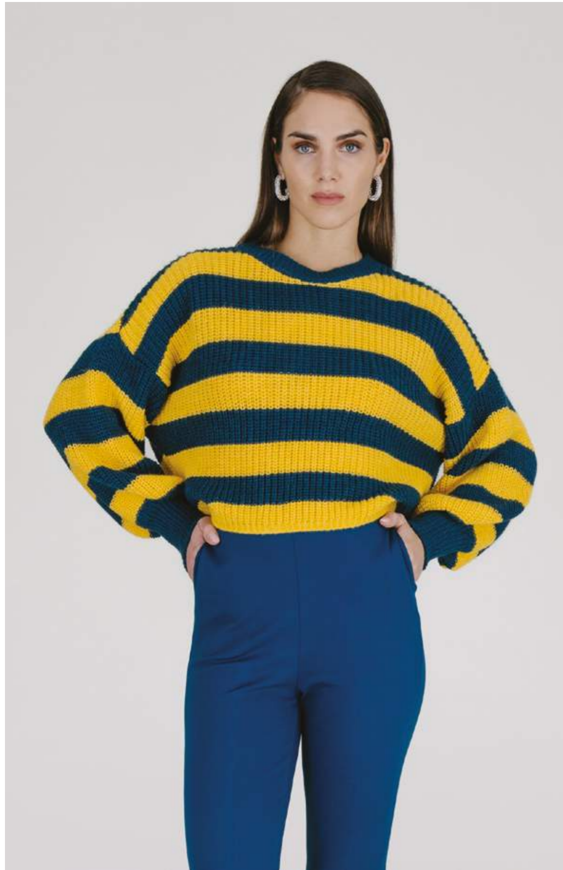
PULLOVER – MLS 336 GIALLO/OTTANIO COLORI DISPONIBILI: PRUGNA/BUBBLE