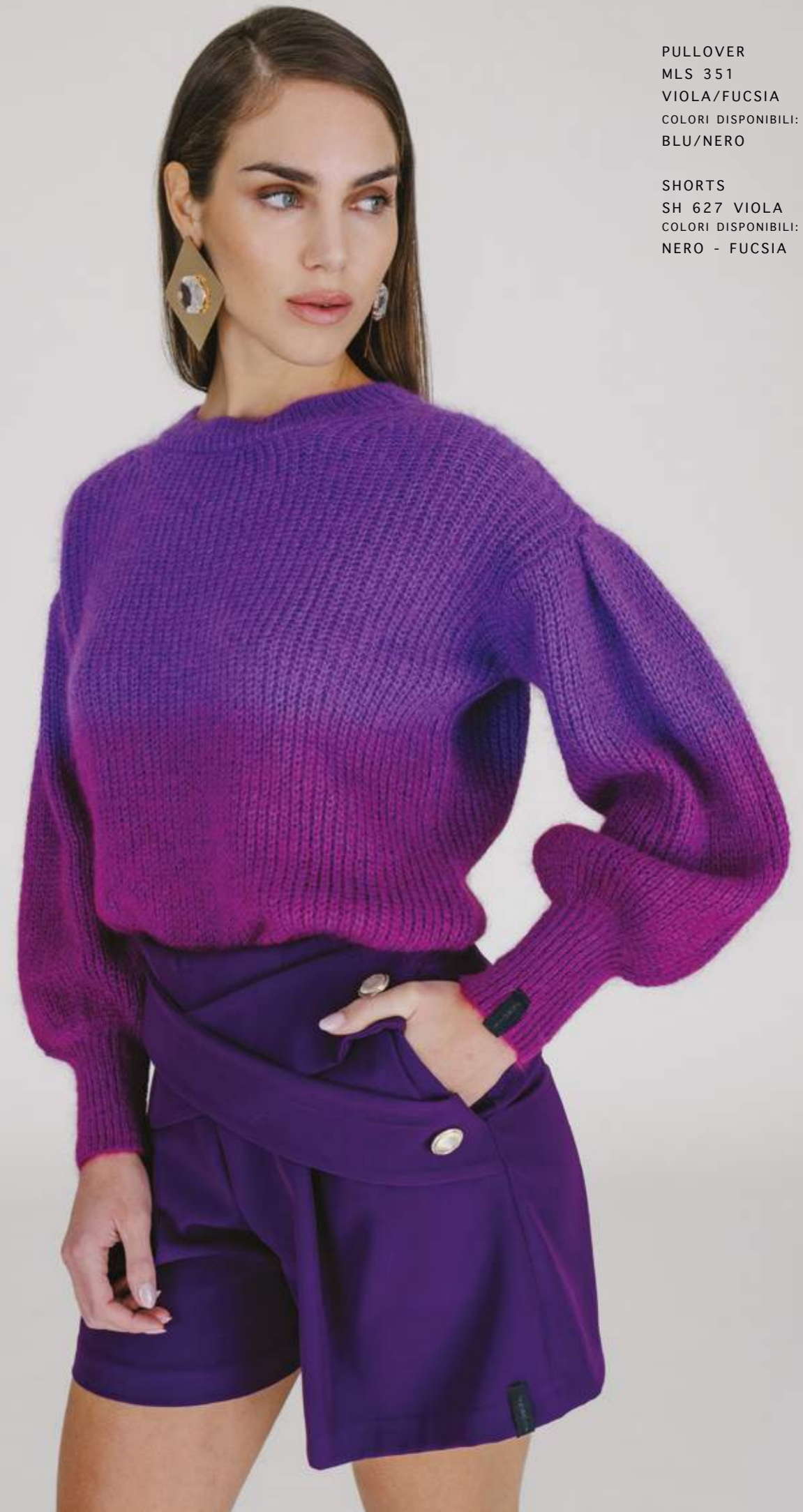
PULLOVER MLS 351 VIOLA/FUCSIA COLORI DISPONIBILI: BLU/NERO