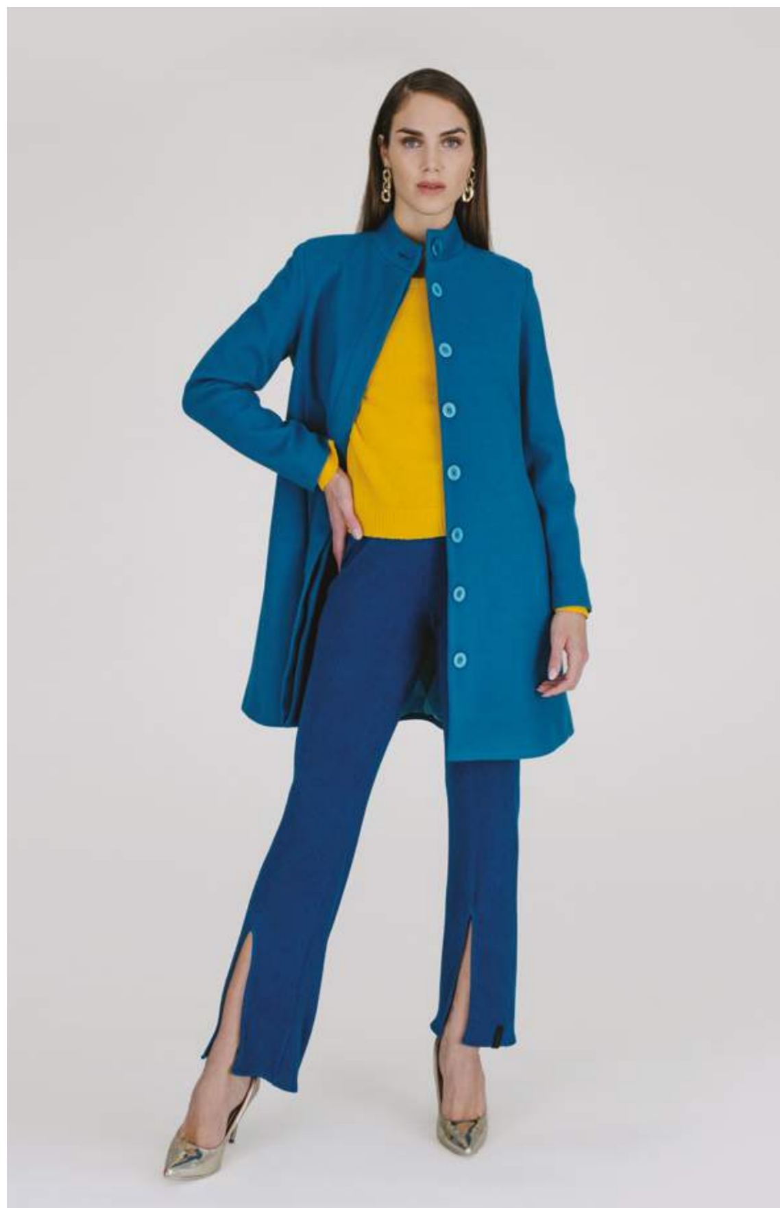
CAPPOTTO – CP 396 OTTANIO COLORI DISPONIBILI: NERO - PANNA