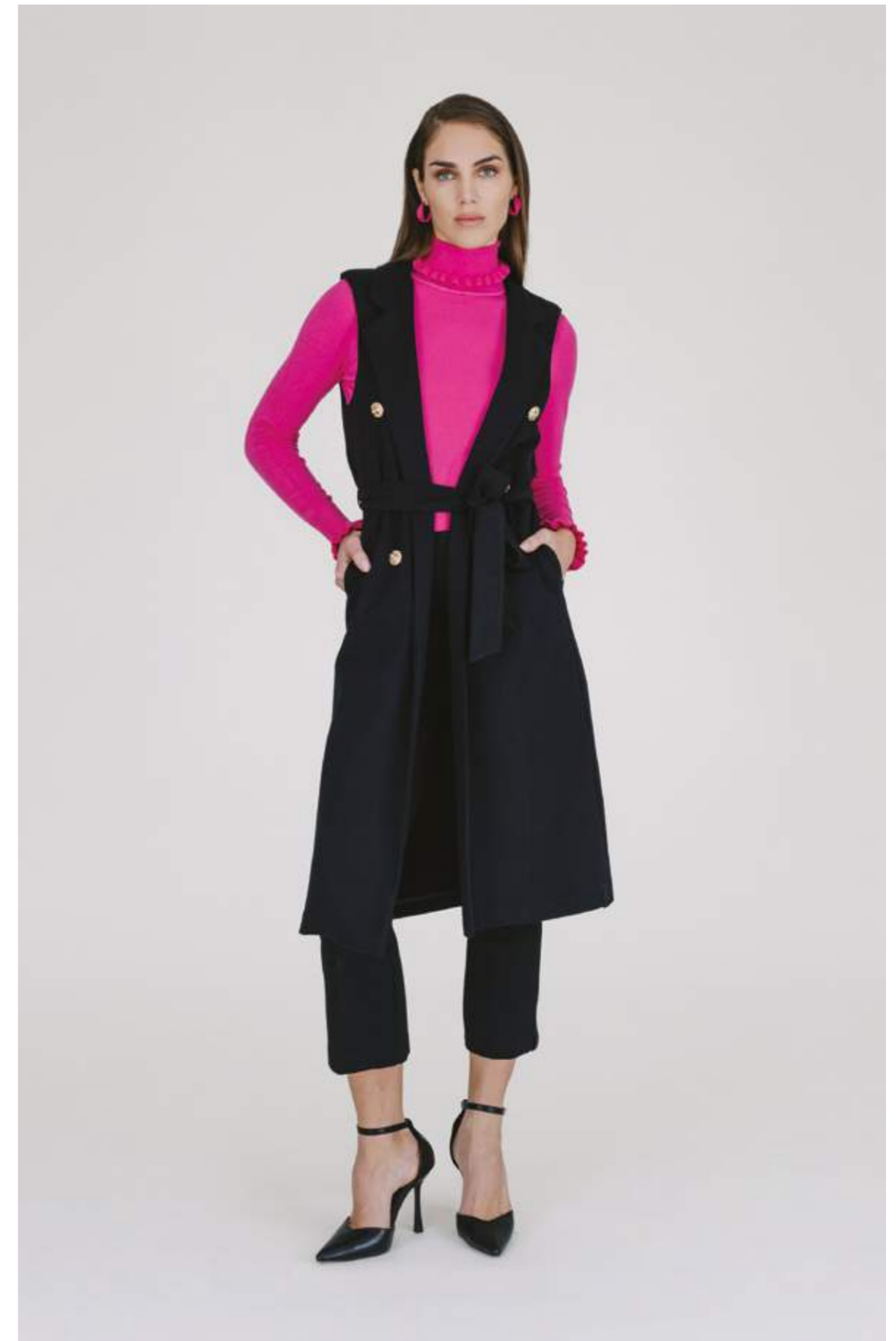
GILET – GL 490 NERO COLORI DISPONIBILI: MARRONE – ROYAL