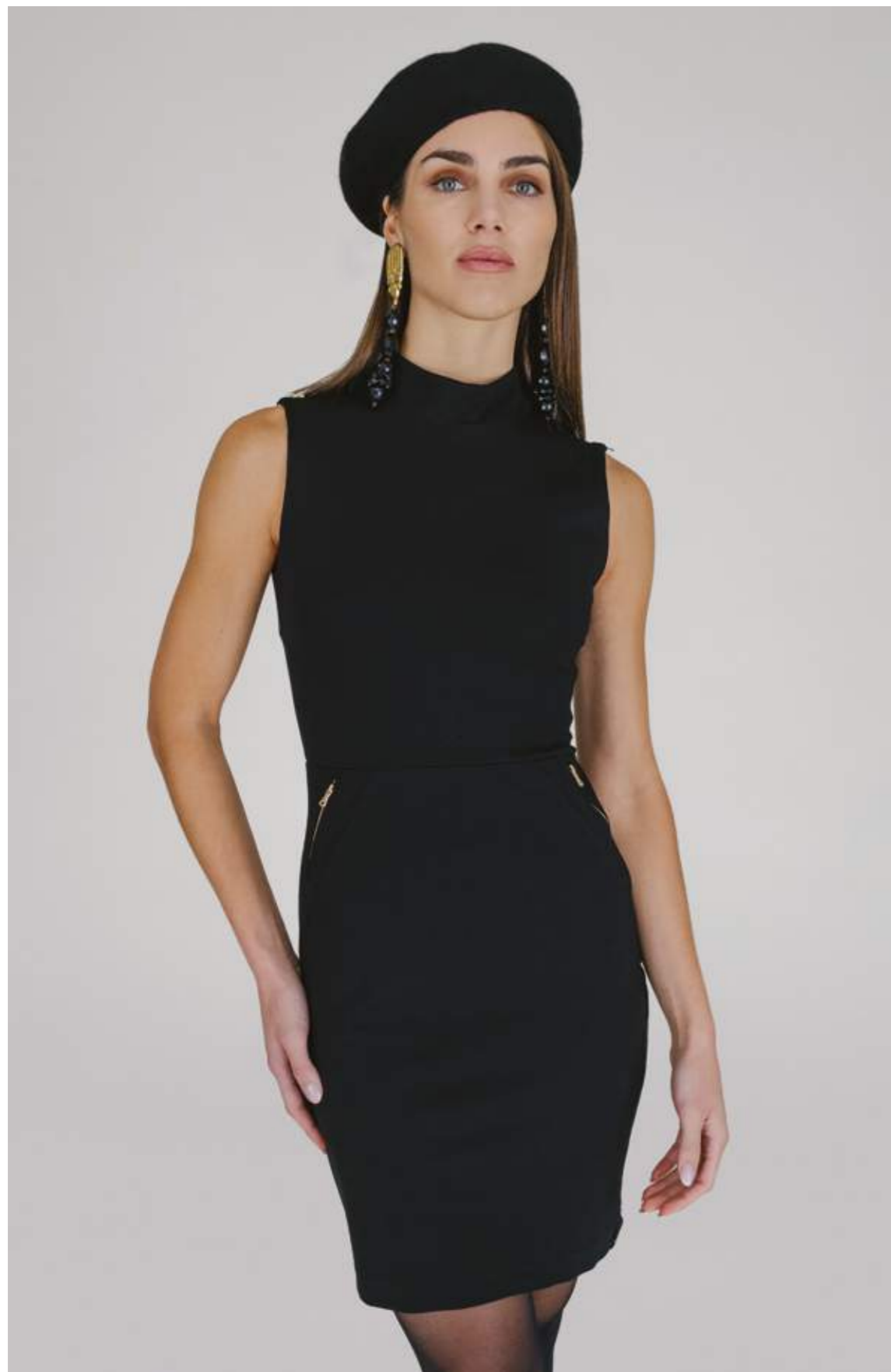
ABITO – AB 967 NERO COLORI DISPONIBILI: FUCCIA – PETROLIO