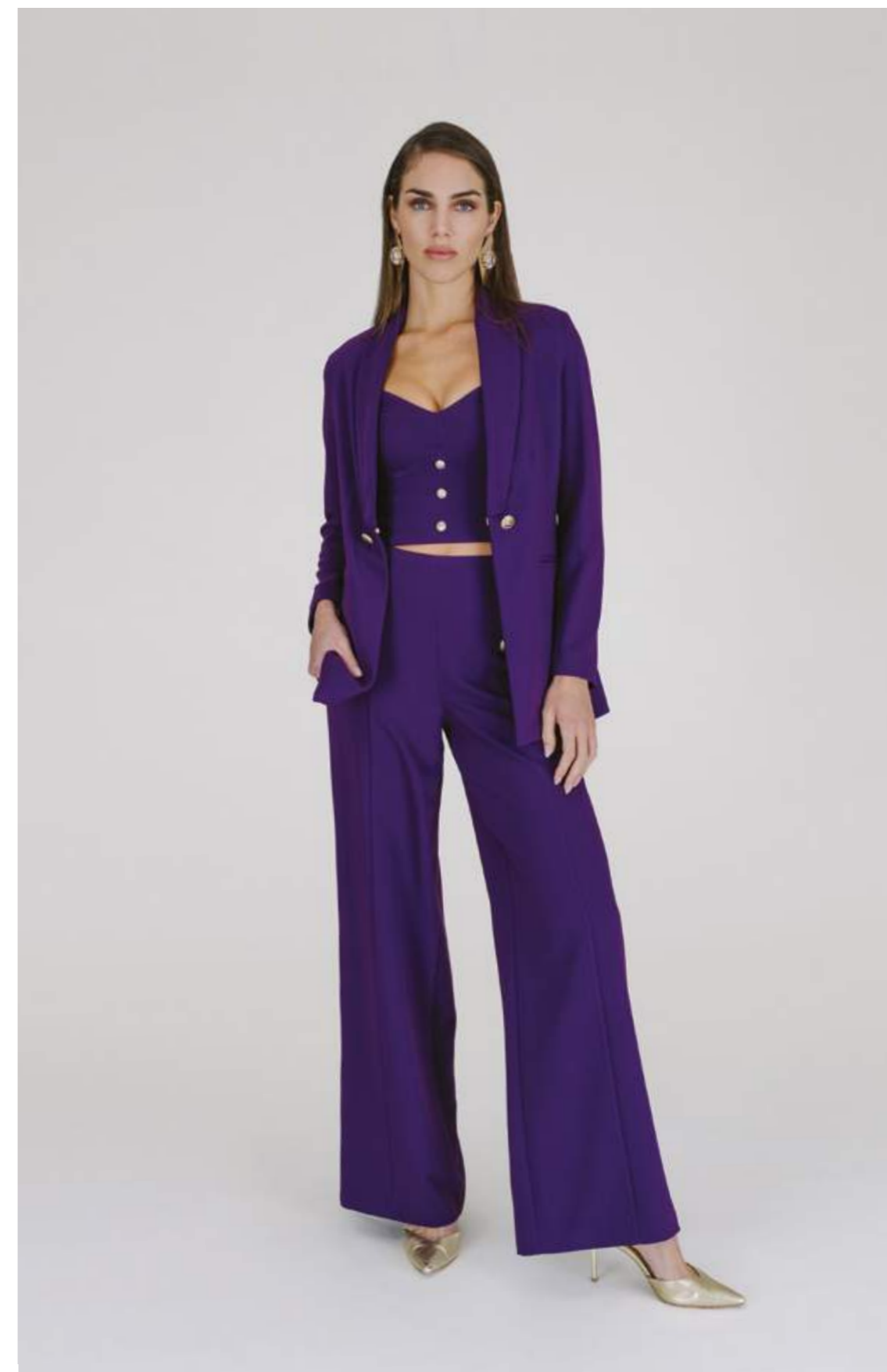
GIACCA – GC 728 VIOLA COLORI DISPONIBILI: FUCSIA – NERO