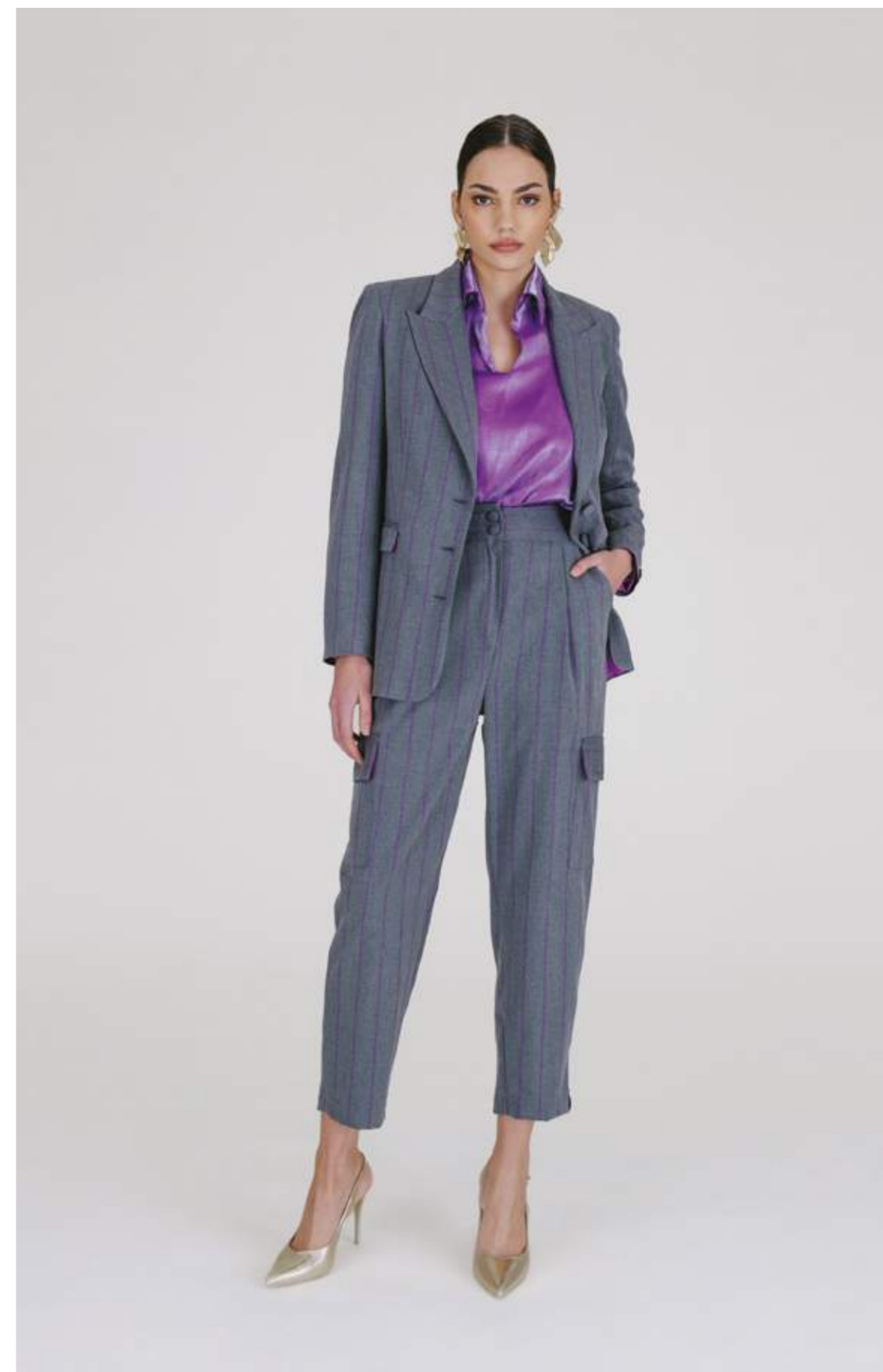
GIACCA – GC 740 GRIGIO/VIOLA COLORI DISPONIBILI: VERDE/RUGGINE