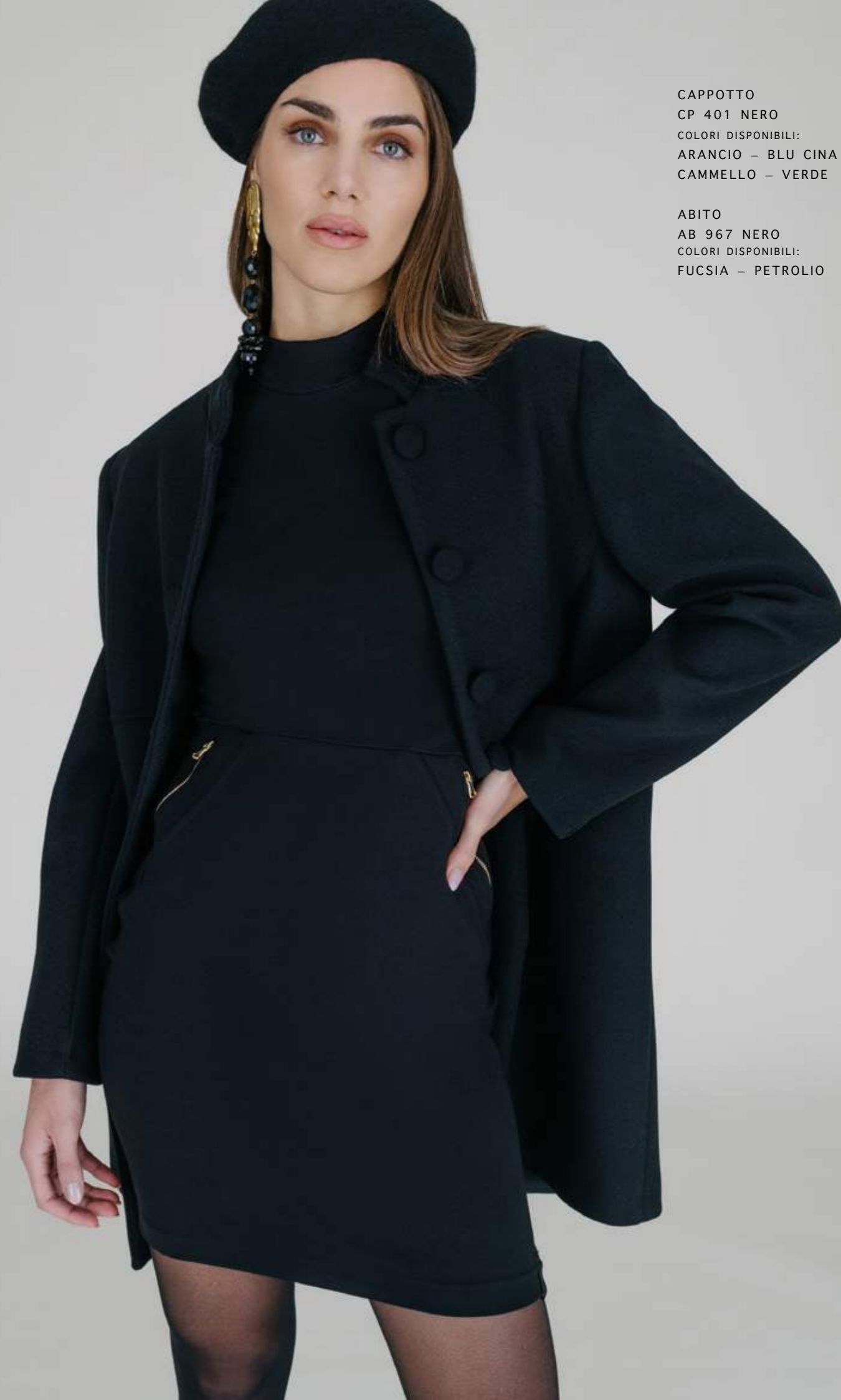
CAPPOTTO CP 401 NERO COLORI DISPONIBILI: ARANCIO – BLU CINA CAMMELLO – VERDE