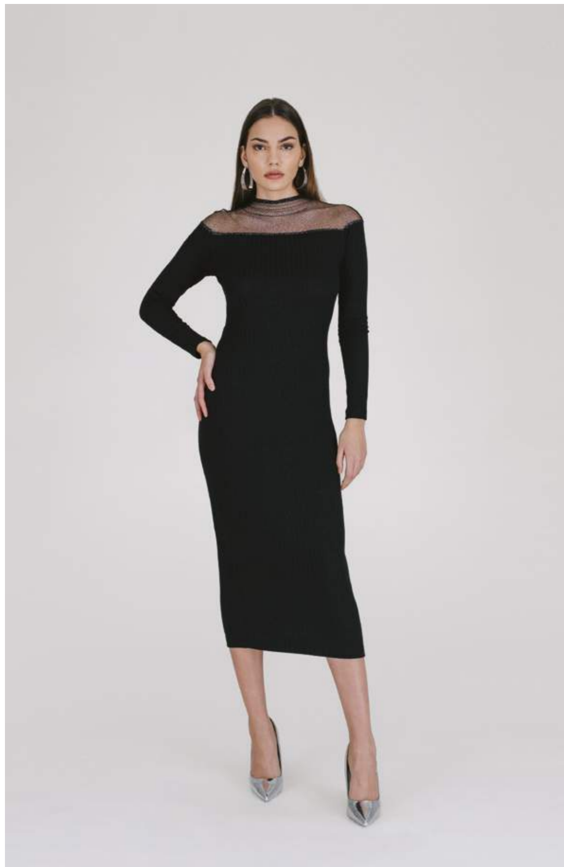
ABITO – AB 977 NERO COLORI DISPONIBILI: VERDE TIFFANY