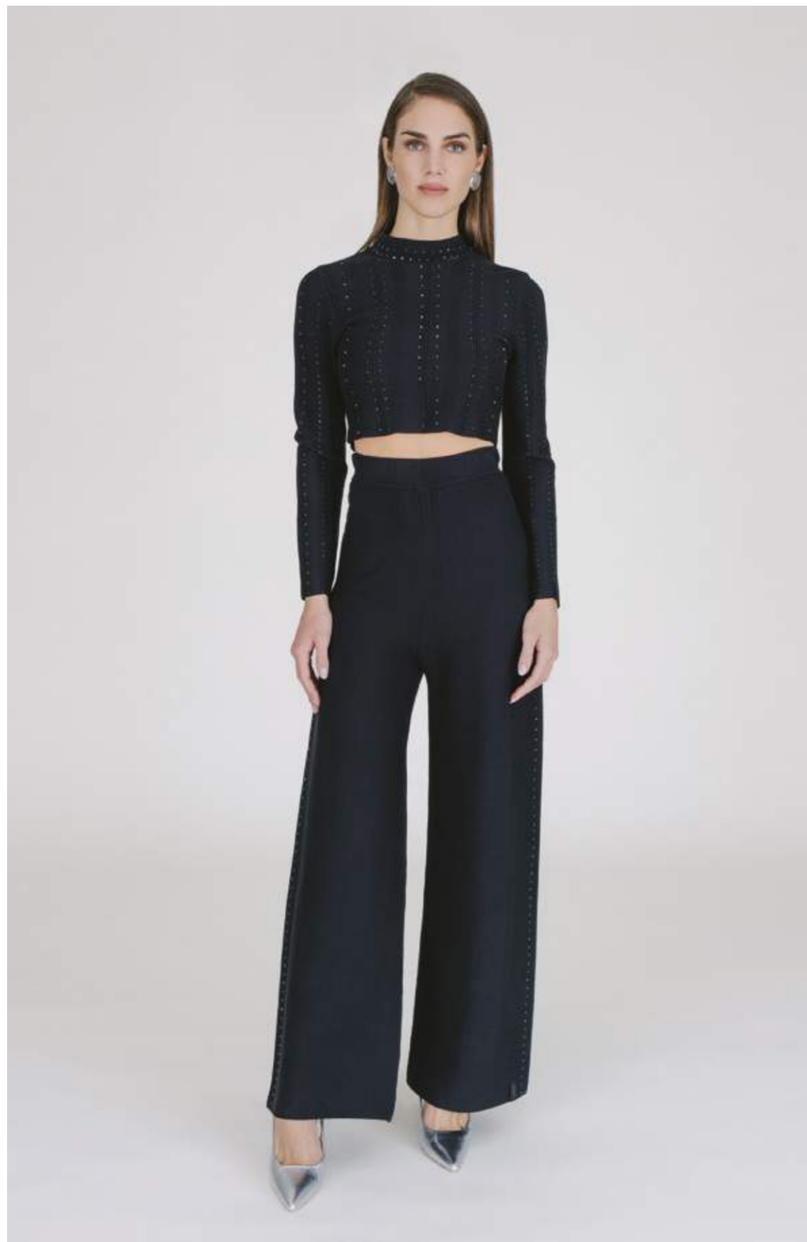
PULLOVER – MLS 346