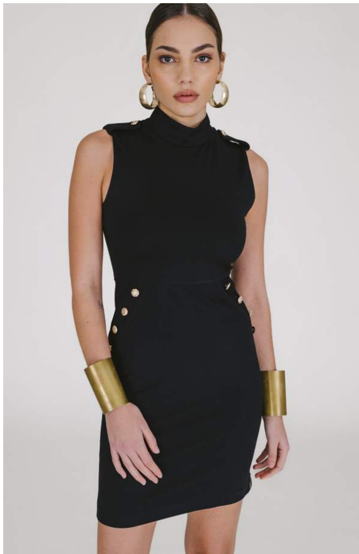
ABITO – AB 1000 NERO COLORI DISPONIBILI: MARRONE – ROYAL