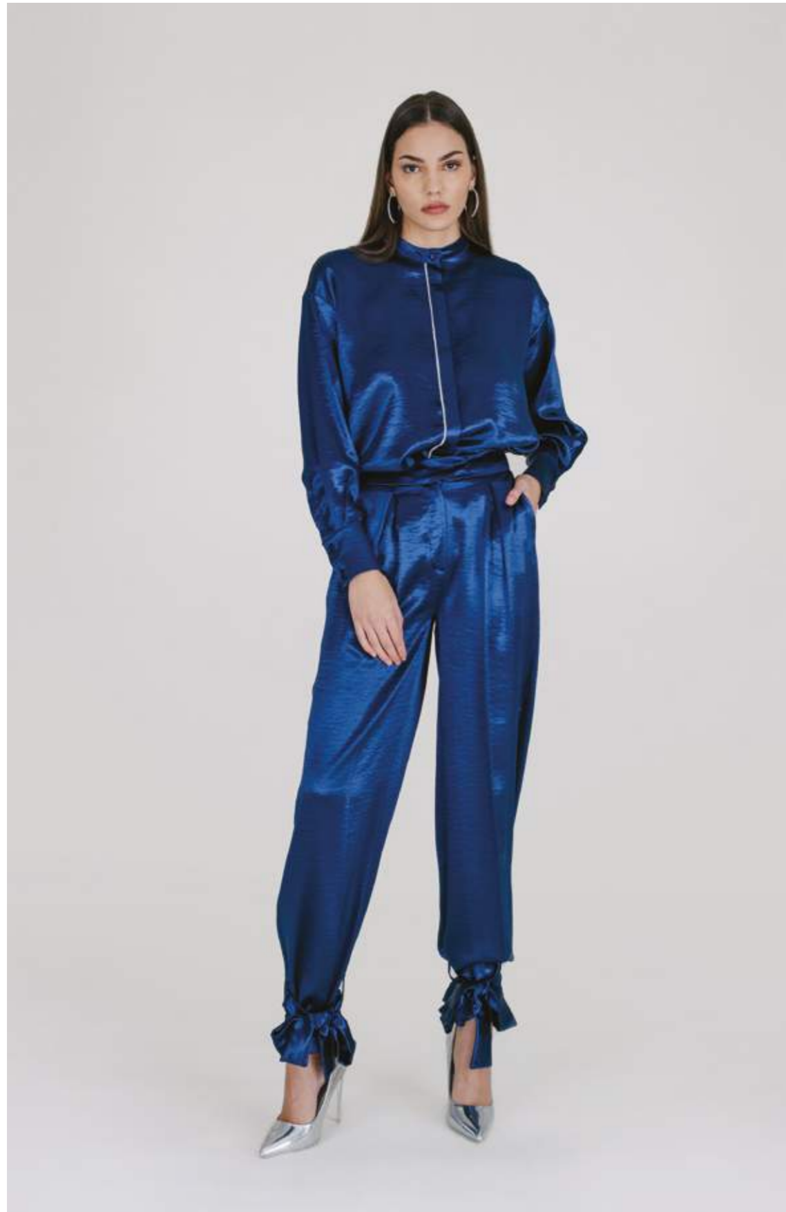
CAMICIA – CM 768 BLU COLORI DISPONIBILI: OLIVA - VIOLA