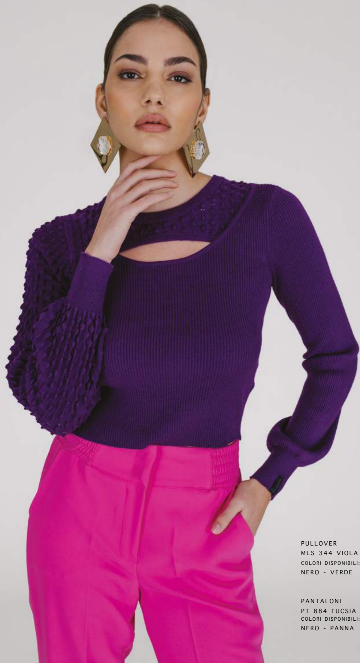
PULLOVER MLS 344 VIOLA COLORI DISPONIBILI: NERO - VERDE