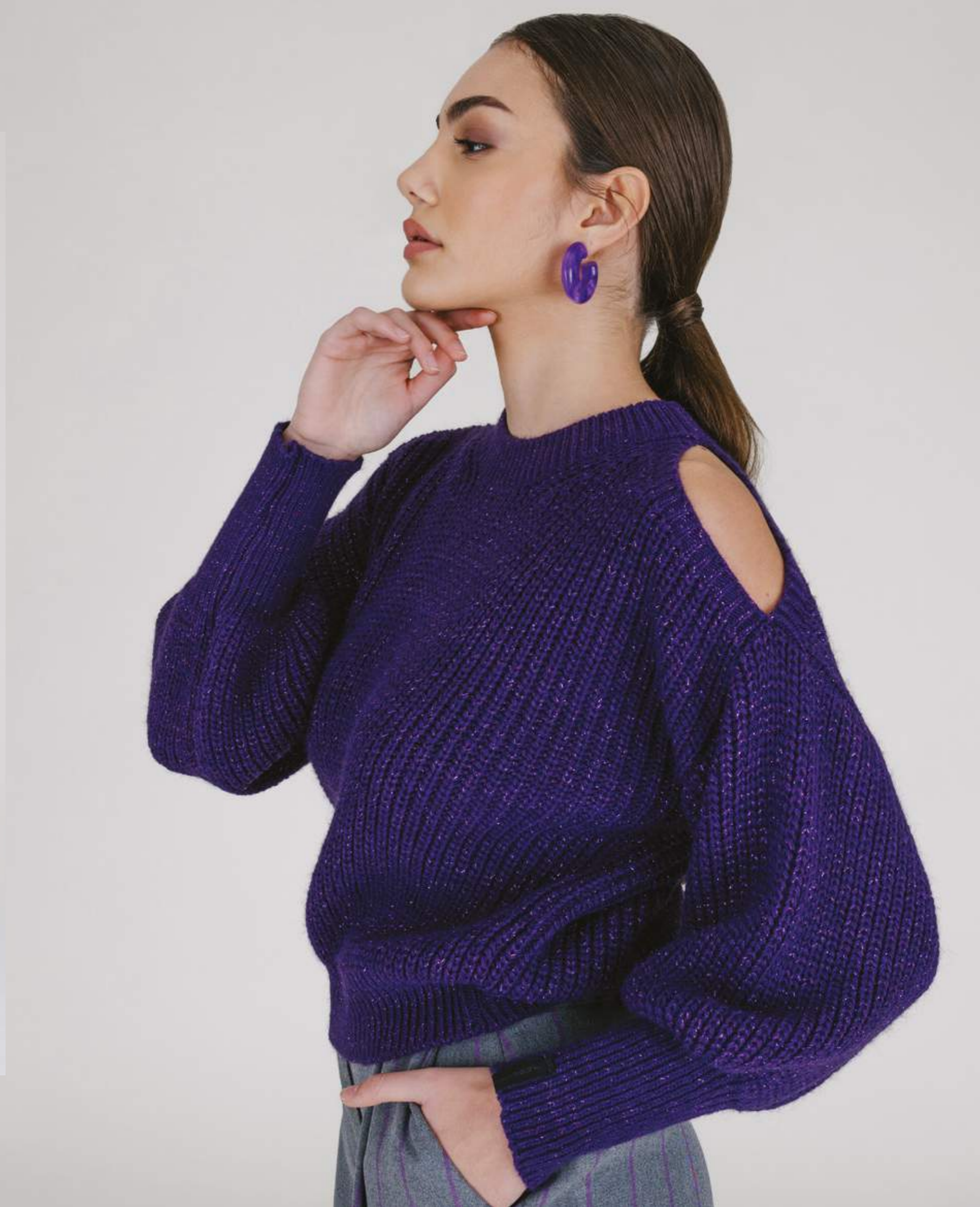
PULLOVER – MLS 326 PRUGNA/PORPORA COLORI DISPONIBILI: NERO – PANNA/ORO