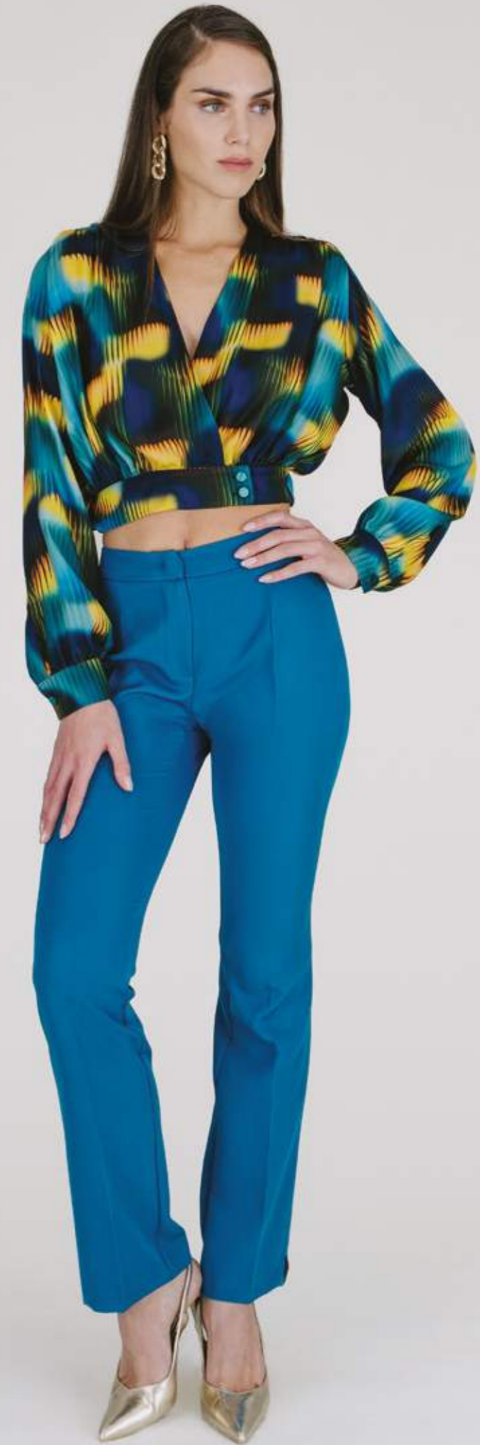
PANTALONI - PT 912 OTTANIO COLORI DISPONIBILI: NERO - ROYAL - RUGGINE VANIGLIA - VERDE