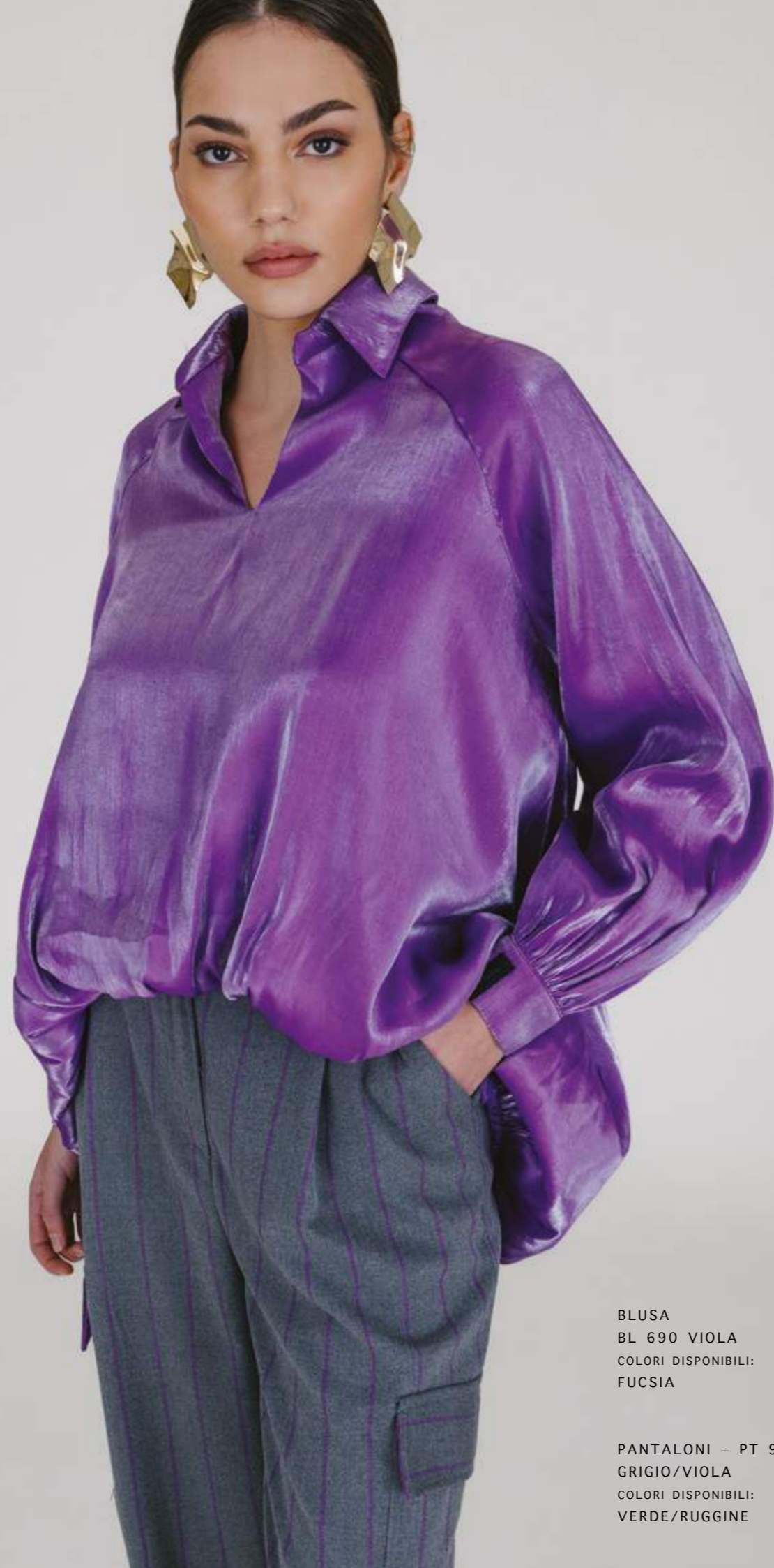
BLUSA BL 690 VIOLA COLORI DISPONIBILI: FUCSIA