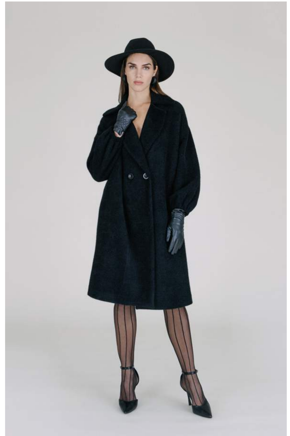
CAPPOTTO – CP 405 NERO COLORI DISPONIBILI: OTTANIO - ROYAL