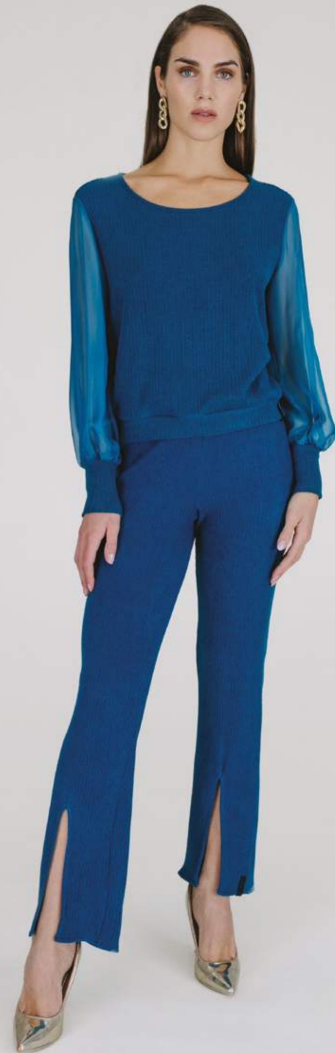
PANTALONI – PT 886 OTTANIO COLORI DISPONIBILI: MORO - NERO