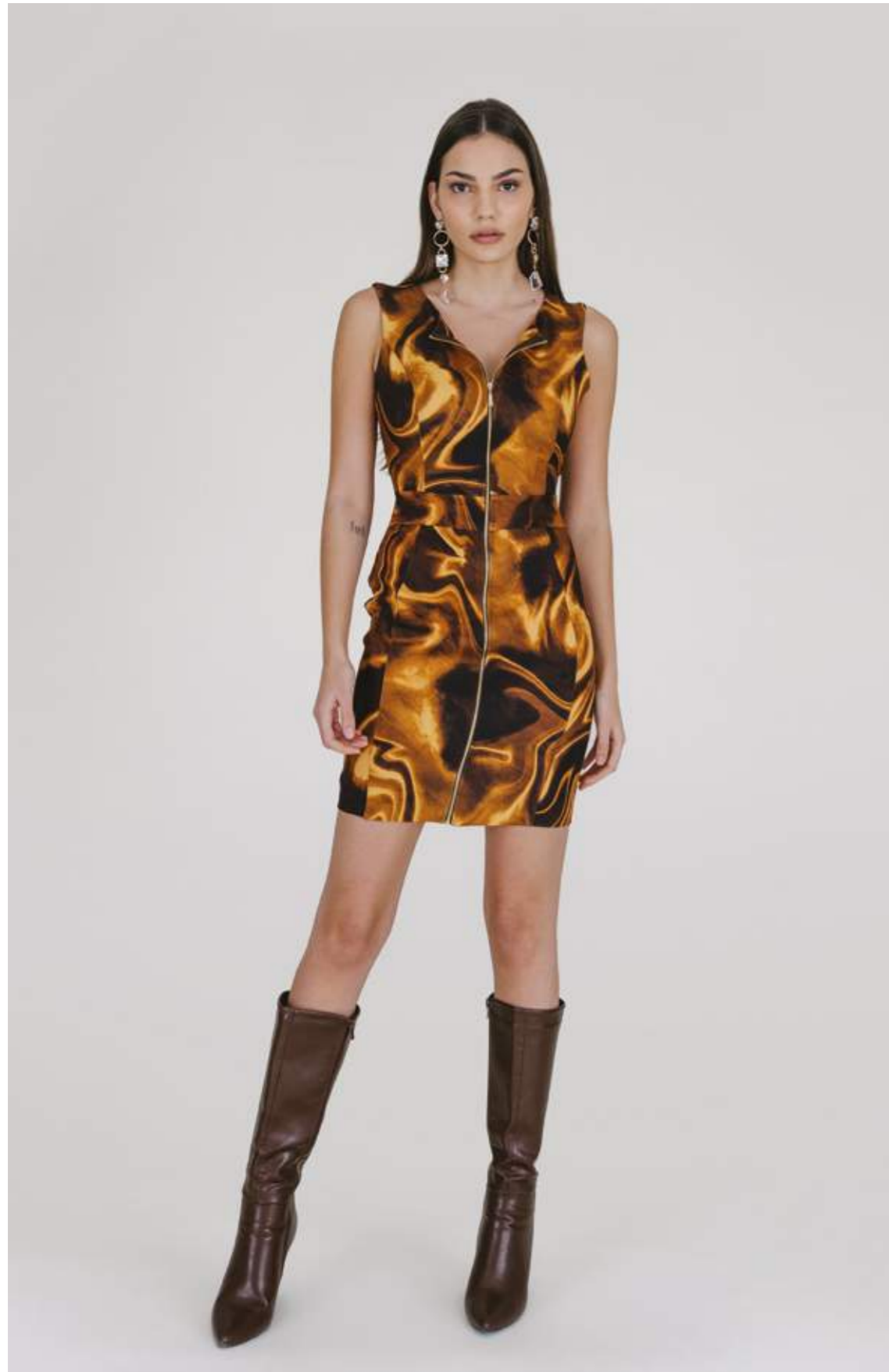
ABITO AB 998