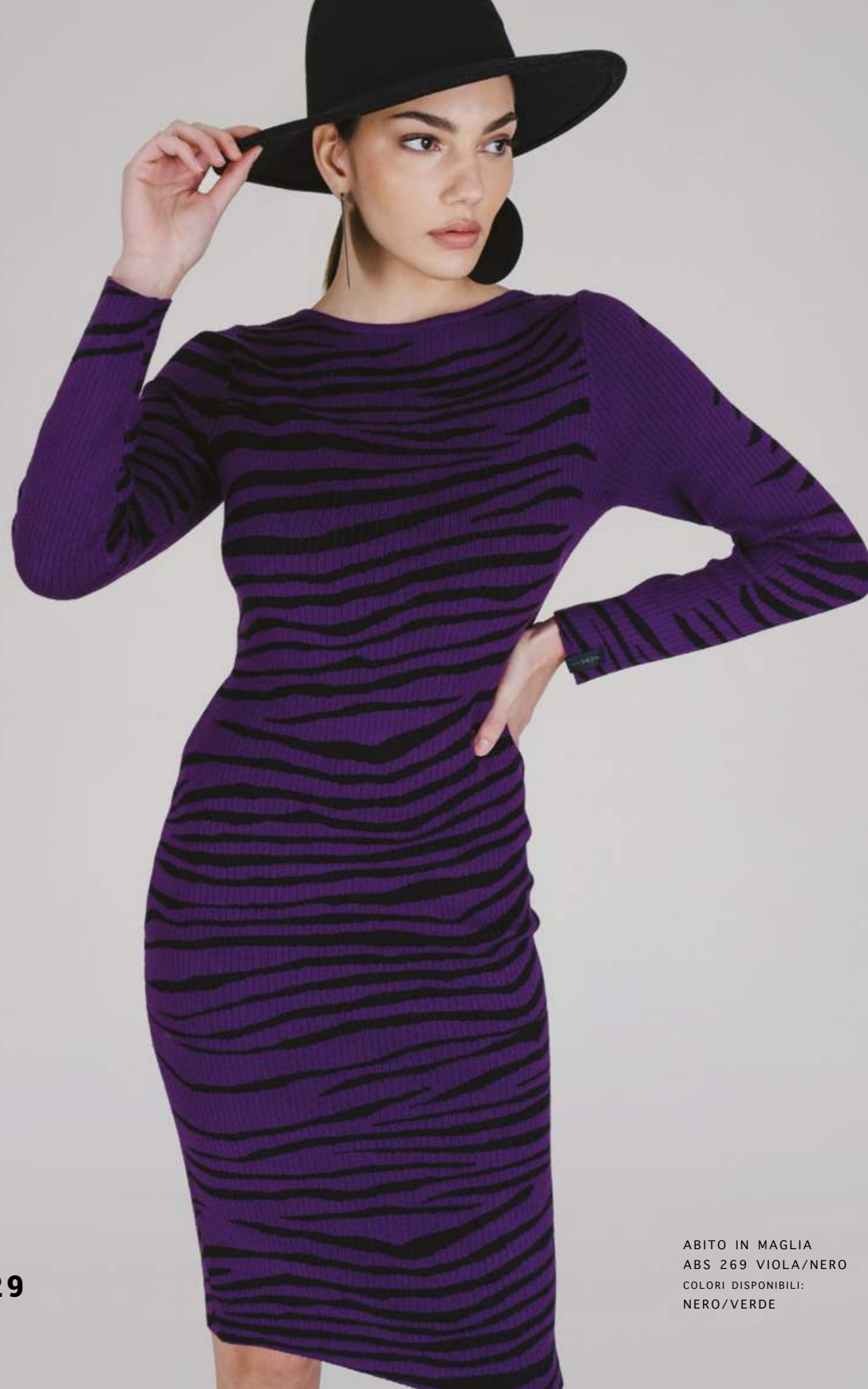
ABITO IN MAGLIA ABS 269 VIOLA/NERO COLORI DISPONIBILI: NERO/VERDE