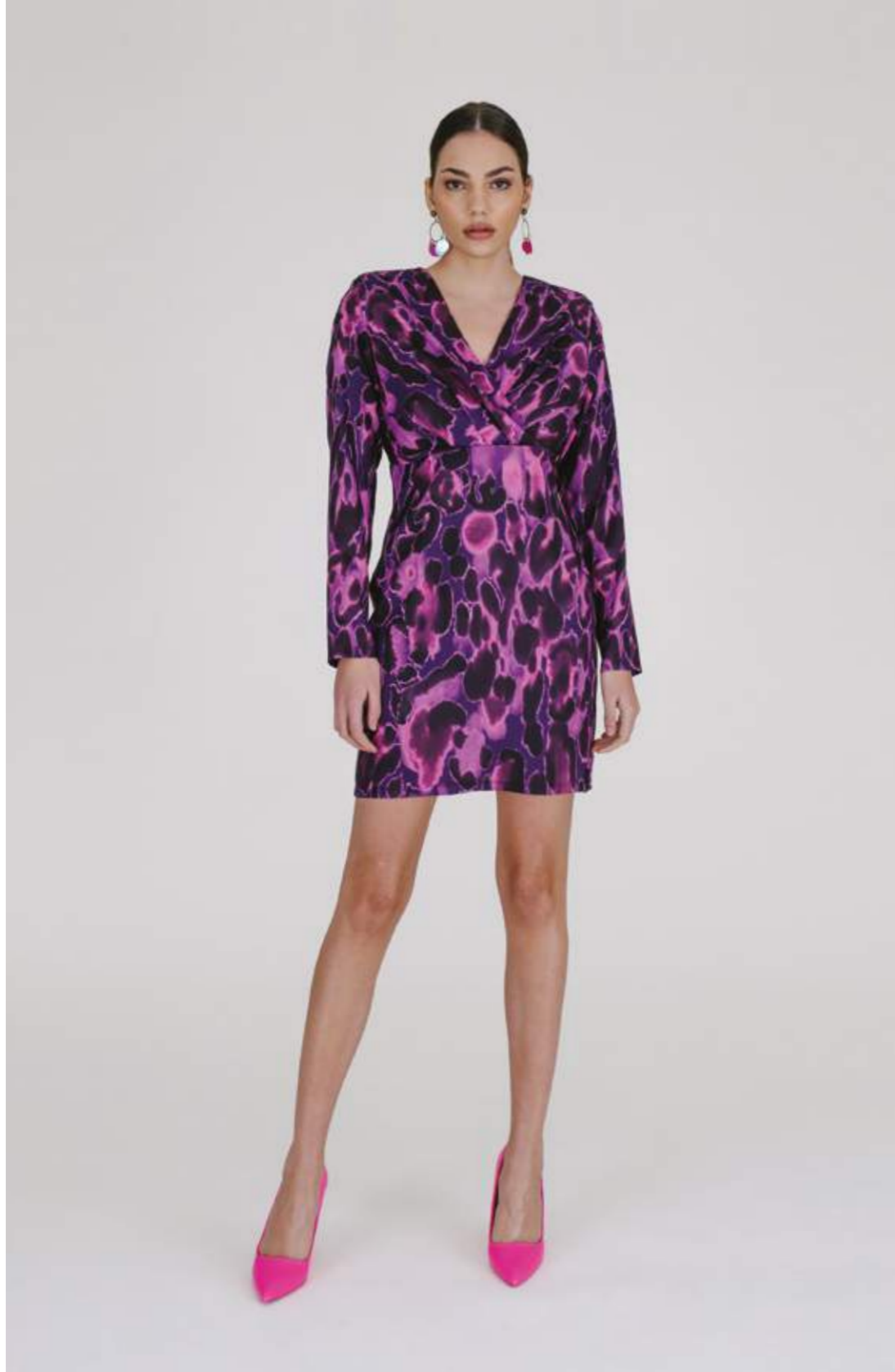
ABITO - AB 972