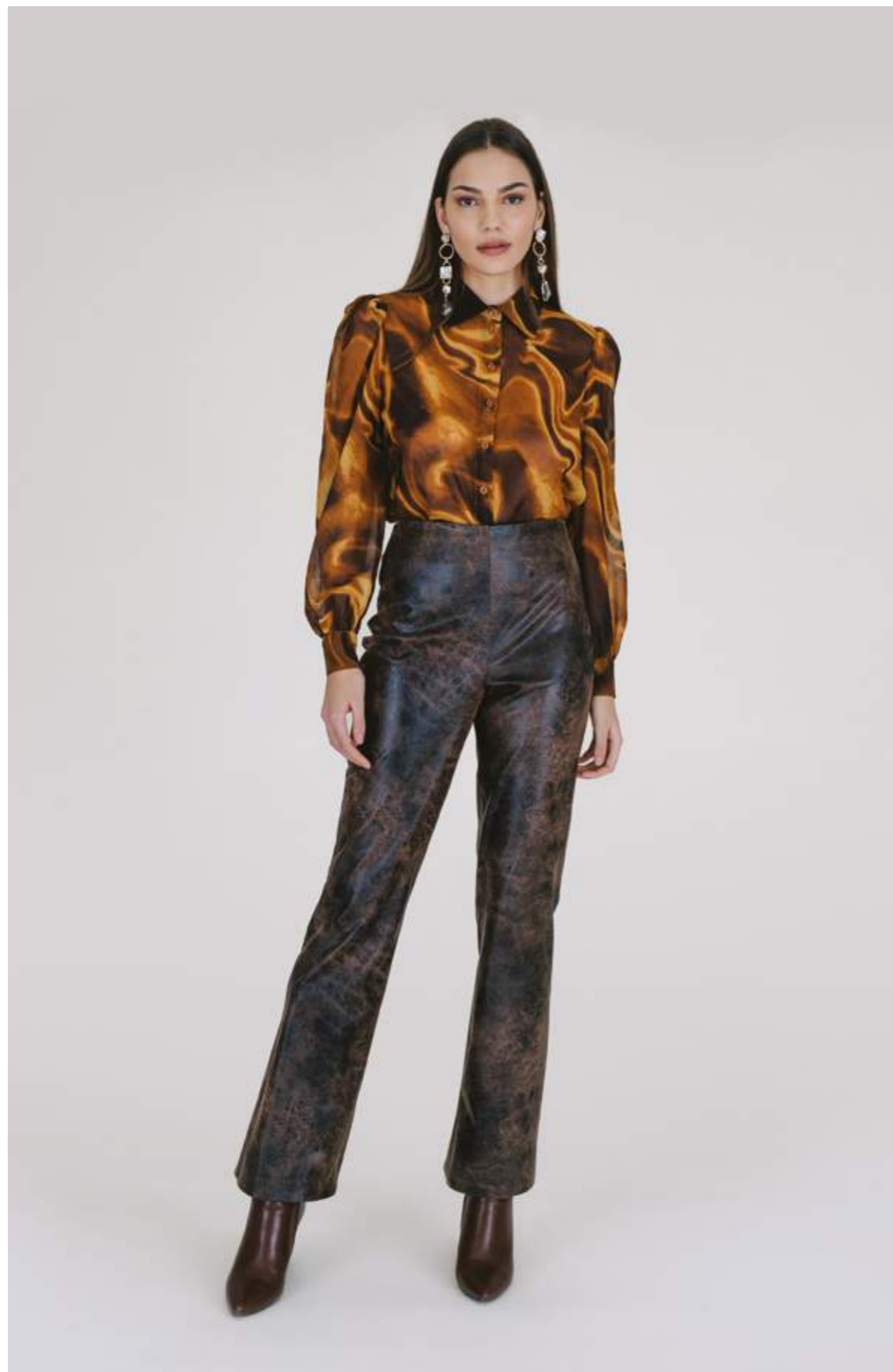
CAMICIA - CM 783 PANTALONI - PT 915