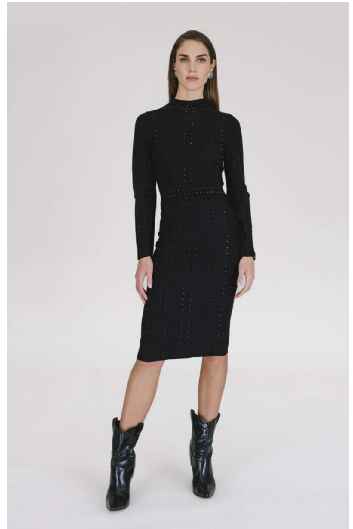
ABITO IN MAGLIA ABS 268