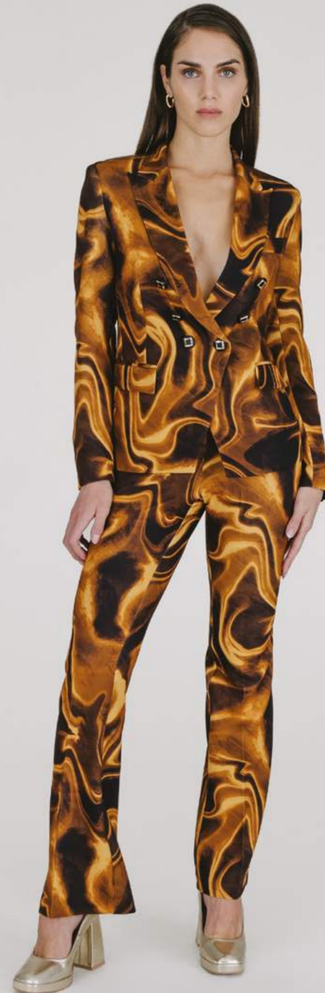
PANTALONI – PT 921 NOCCIOLA COLORI DISPONIBILI: ROYAL