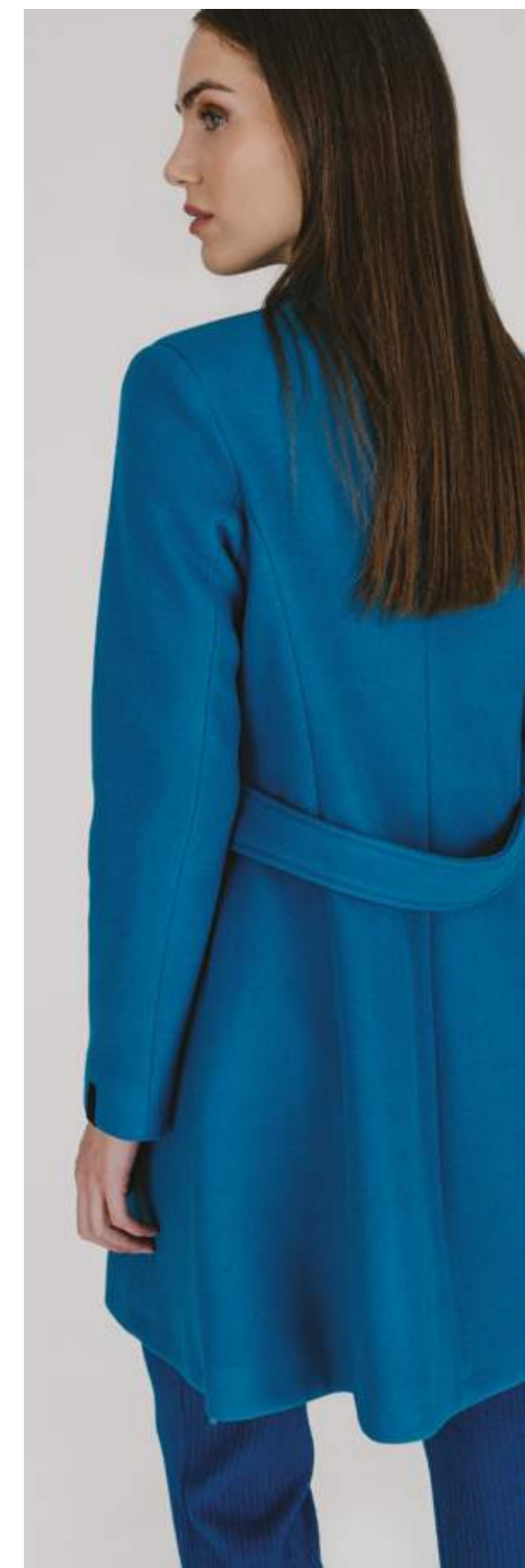
PANTALONI – PT 896 OTTANIO COLORI DISPONIBILI: BEIGE - NERO