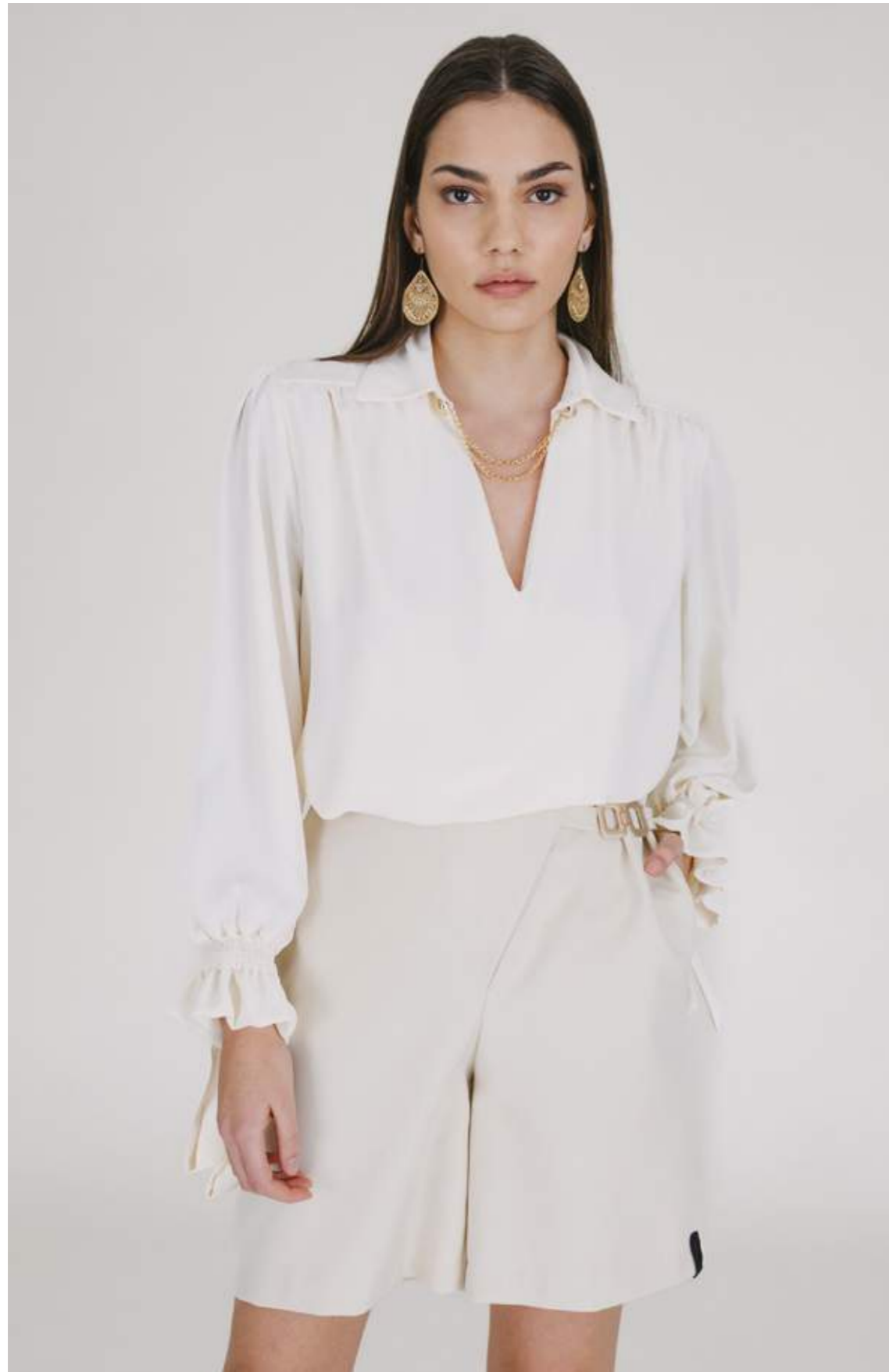
CAMICIA – CM 773 CREMA COLORI DISPONIBILI: NERO - VIOLA