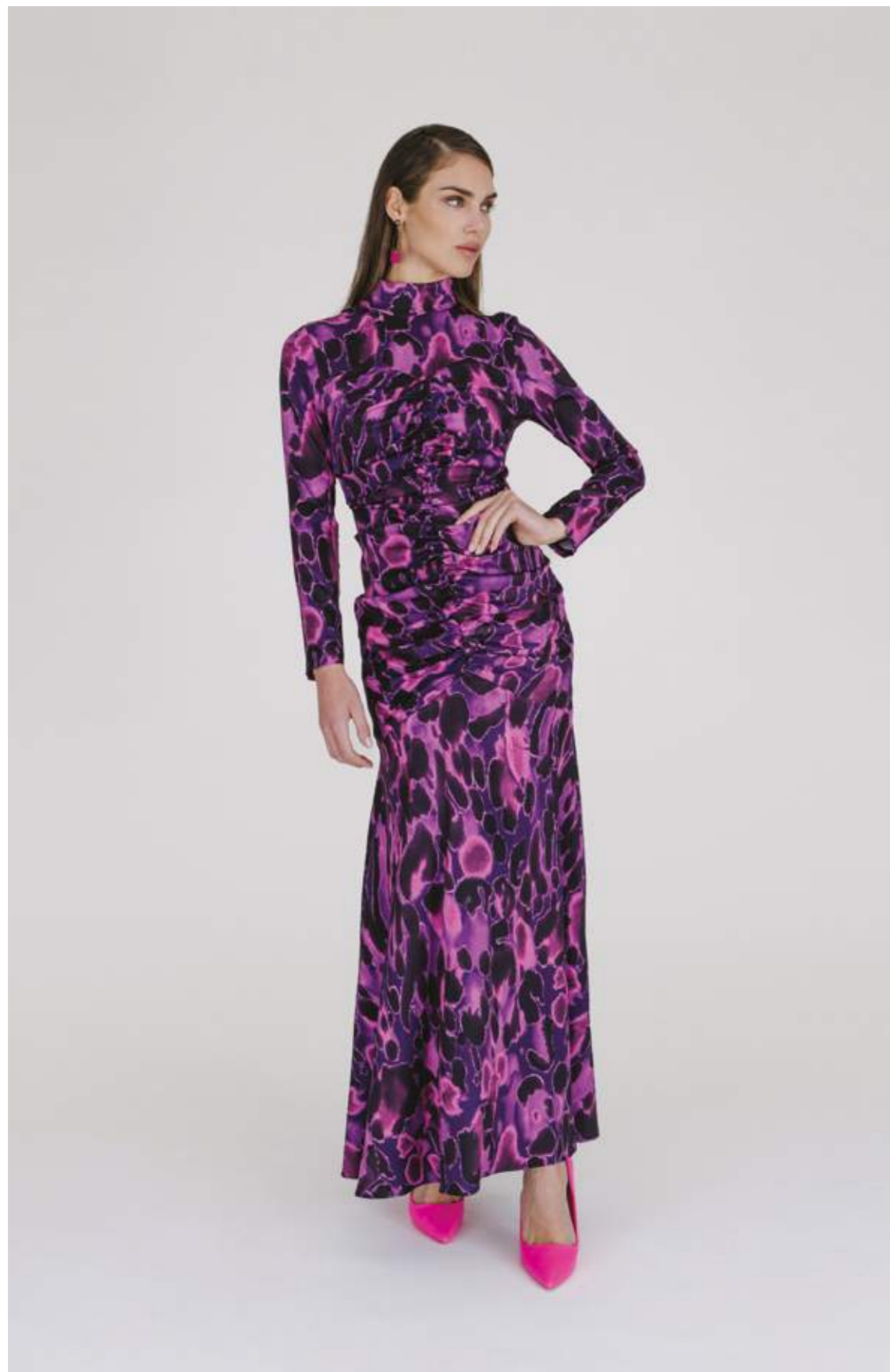
ABITO - AB 979