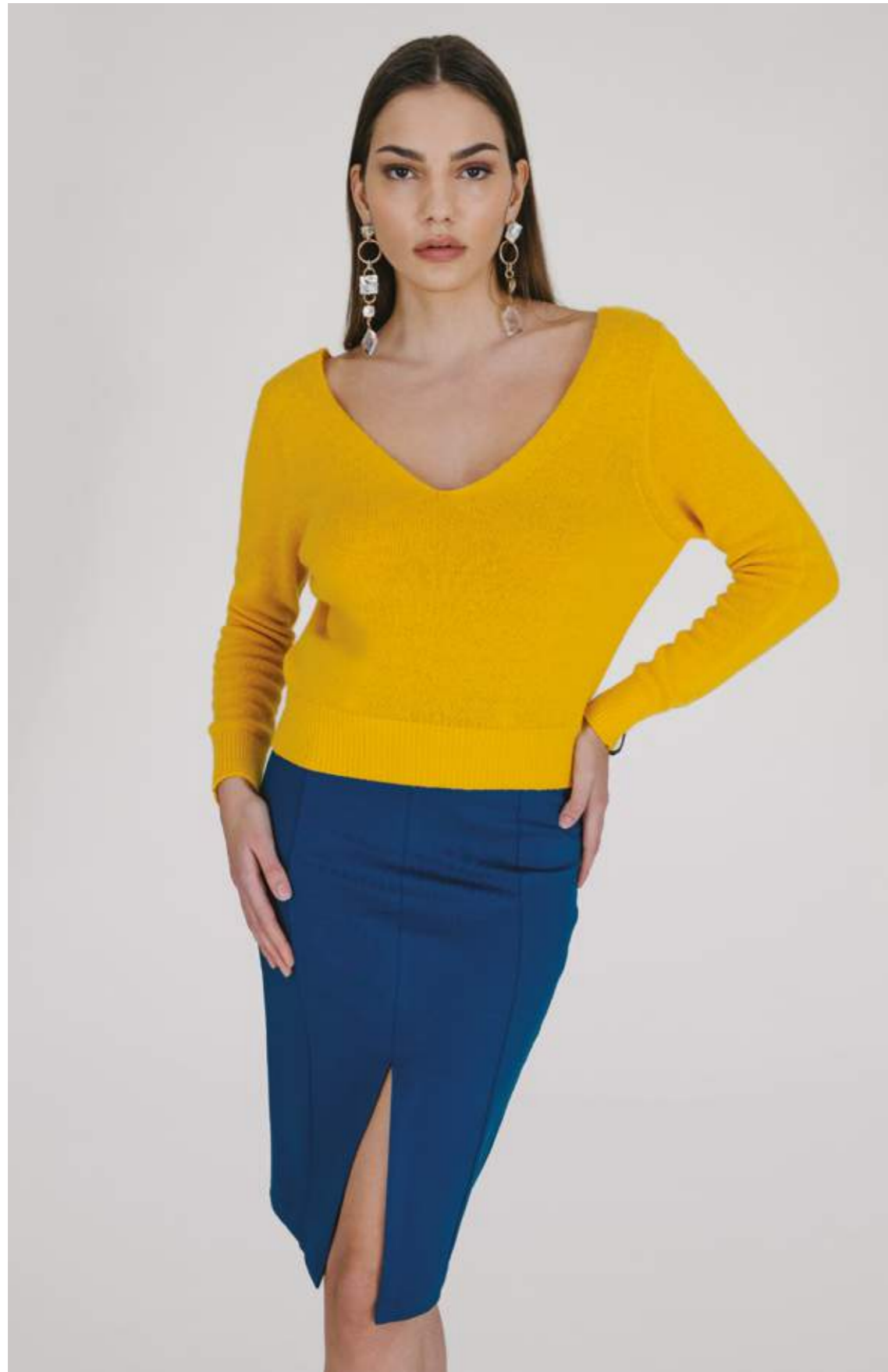
PULLOVER – MLS 332 SENAPE COLORI DISPONIBILI: CAMELLO – NERO – OTTANIO – VERDE