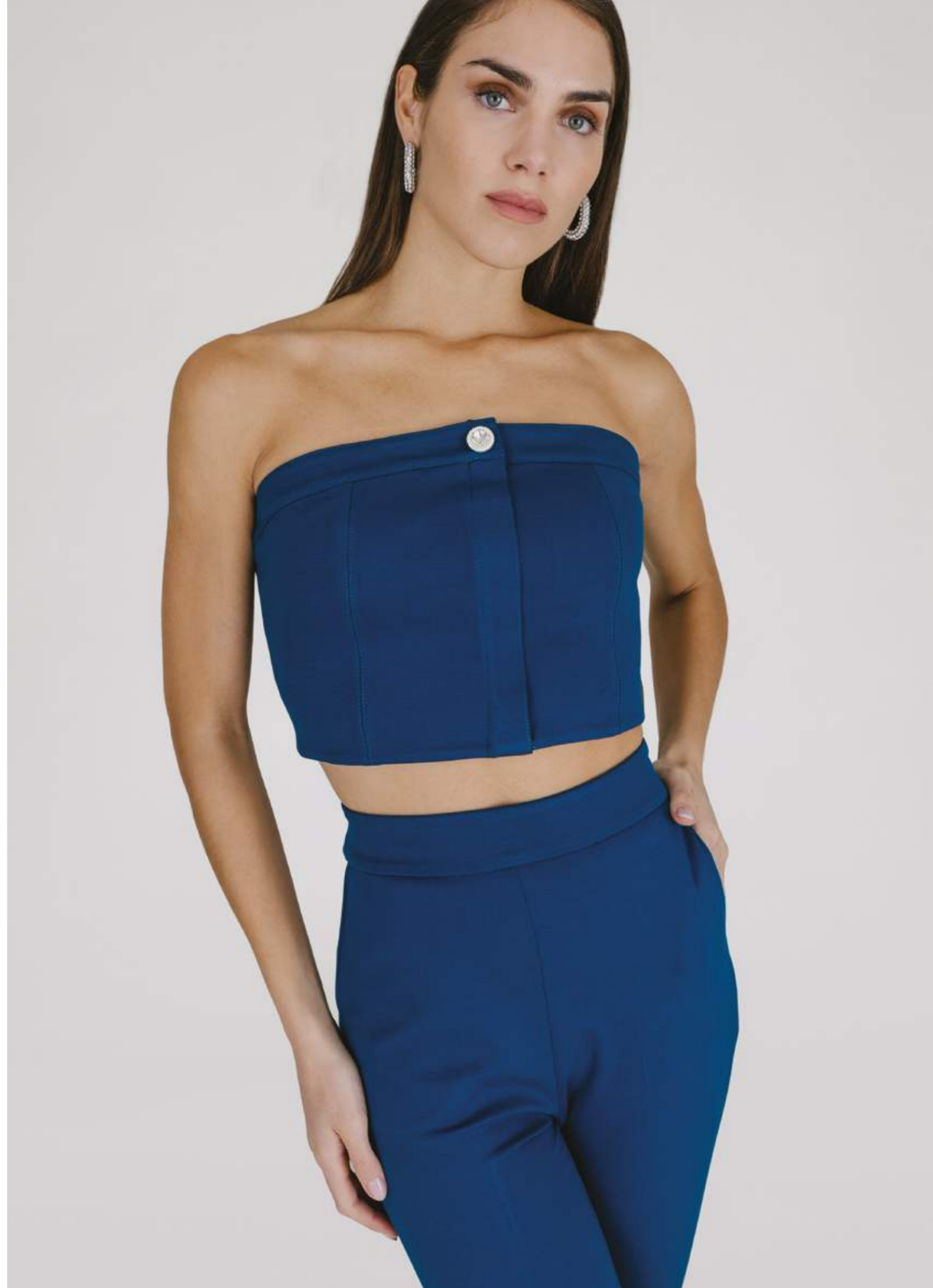
PANTALONI – PT 886 OTTANIO COLORI DISPONIBILI: MORO - NERO