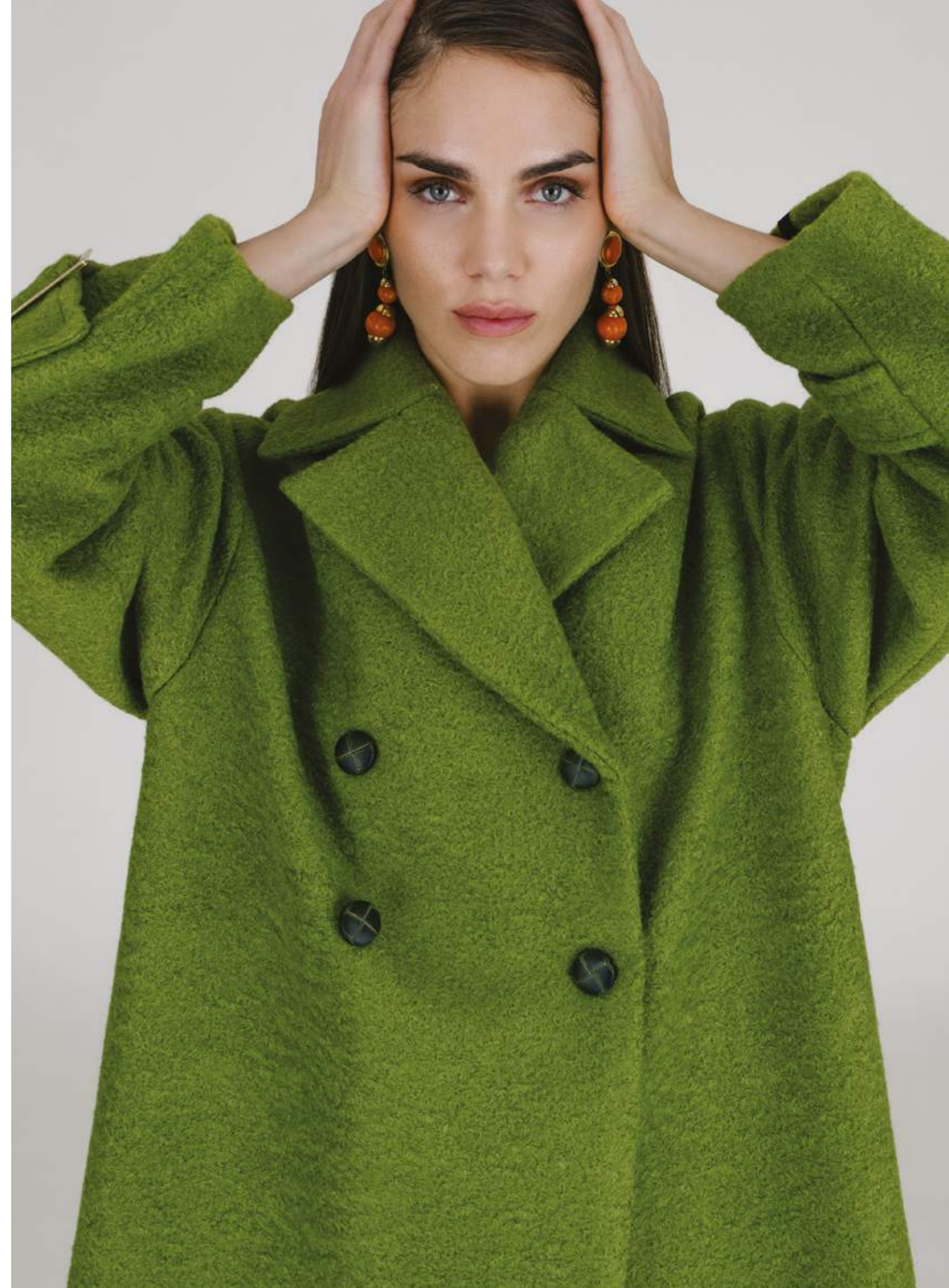
CAPPOTTO – CP 410 VERDE COLORI DISPONIBILI: SENAPE – PANNA