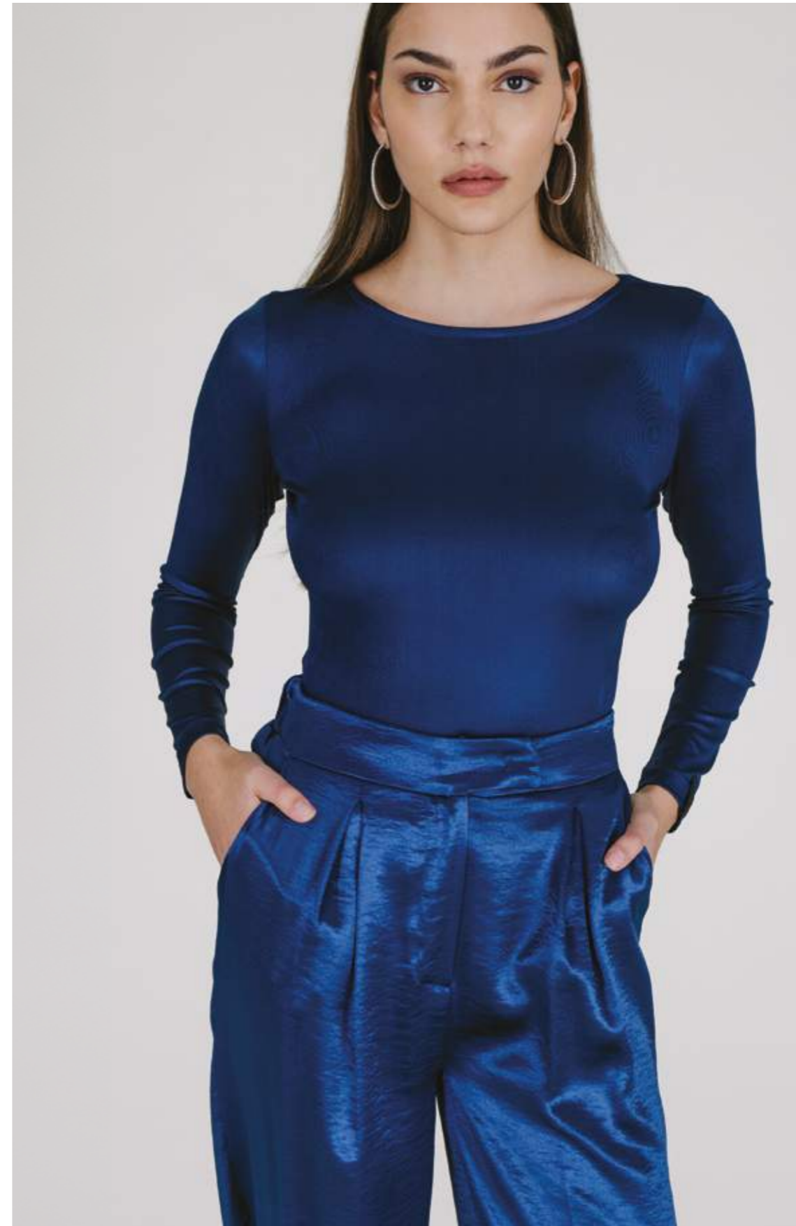
MAGLIA – ML 679 BLU COLORI DISPONIBILI: NERO - TABACCO