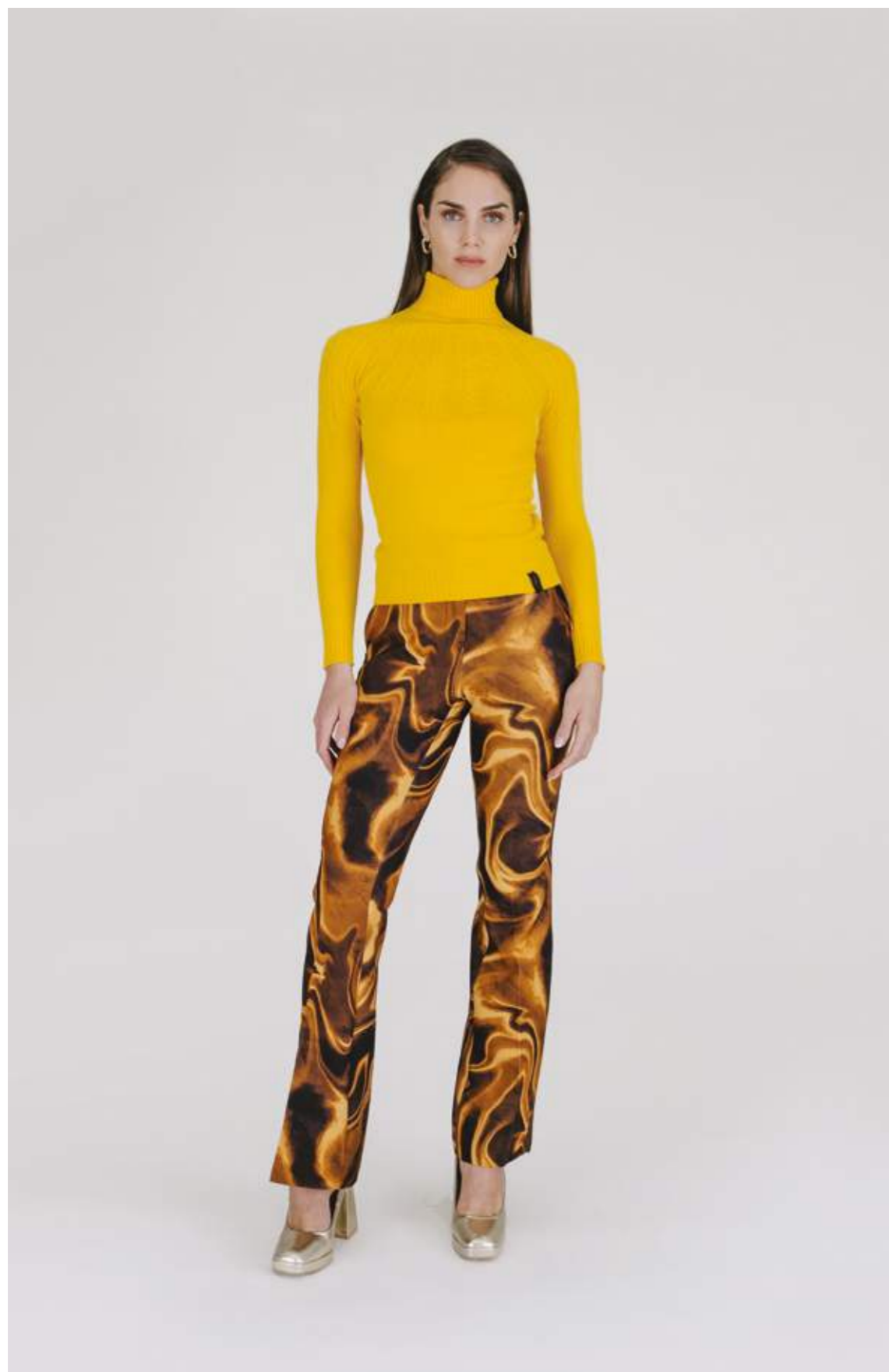
PULLOVER – MLS 337 SENAPE COLORI DISPONIBILI: BRUCIATO – BUBBLE – NERO – PANNA