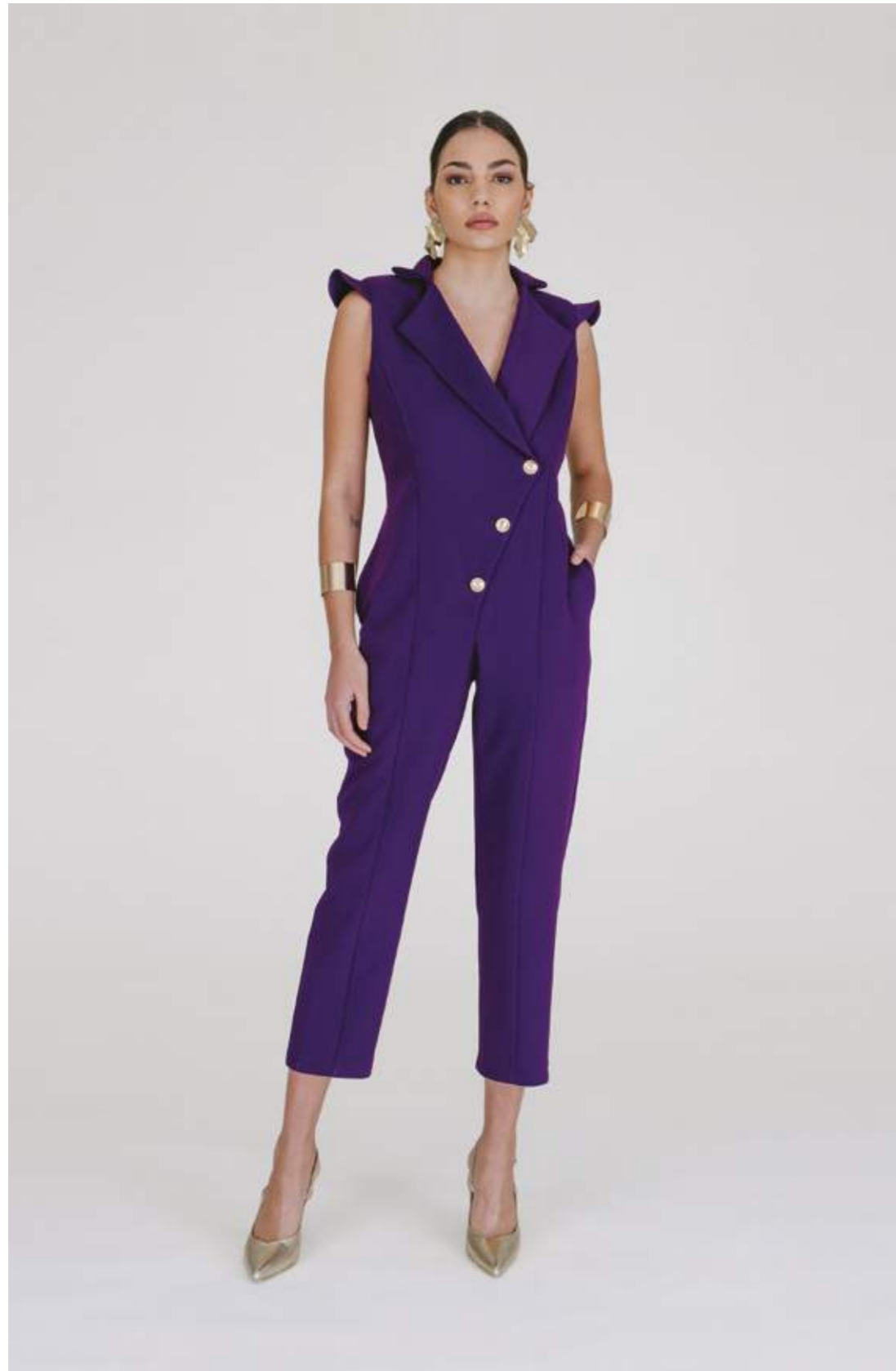
TUTA – TU 580 VIOLA COLORI DISPONIBILI: FUCSIA – NERO