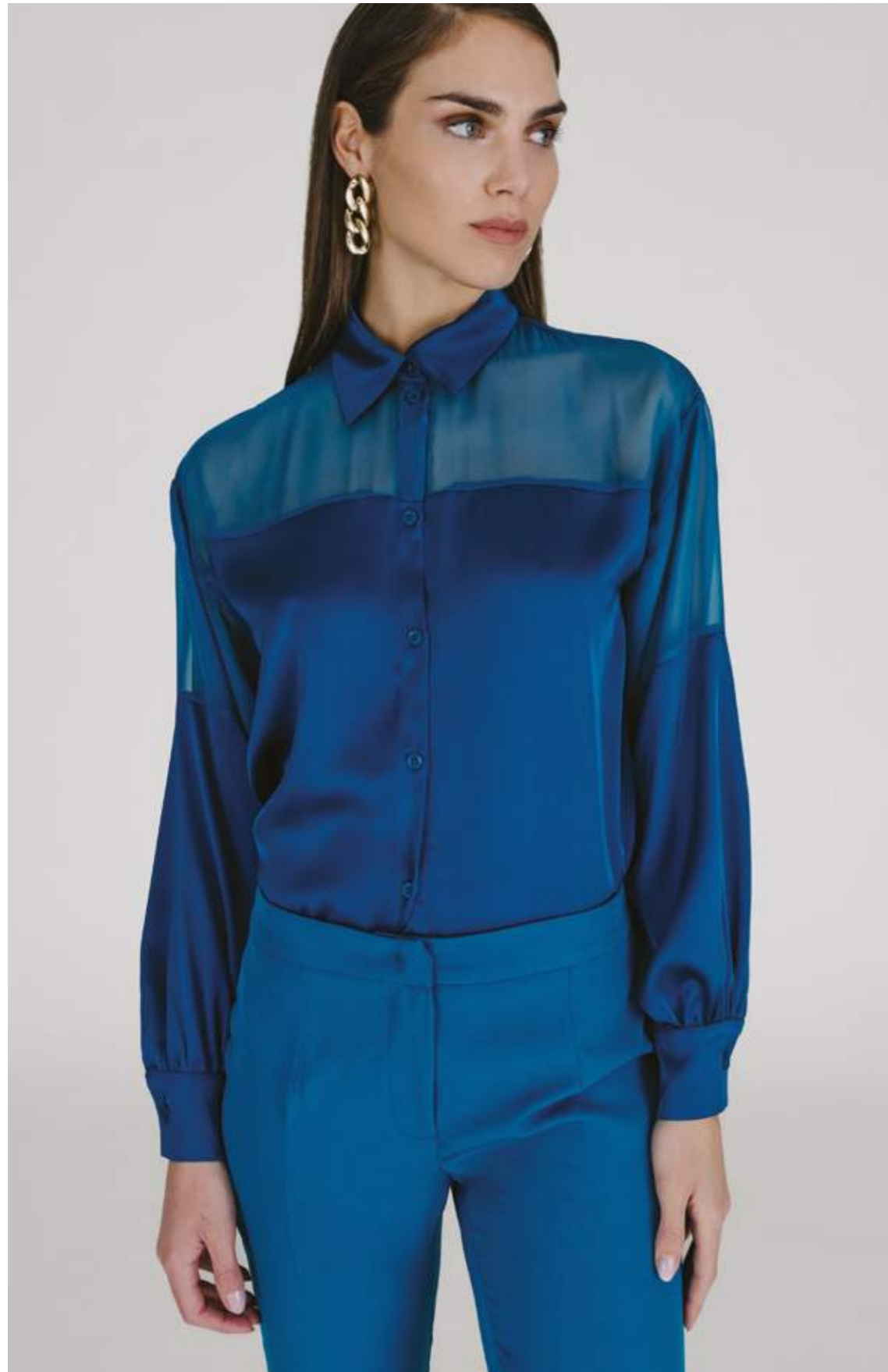
CAMICIA - CM 779 OTTANIO COLORI DISPONIBILI: BIANCO - NERO