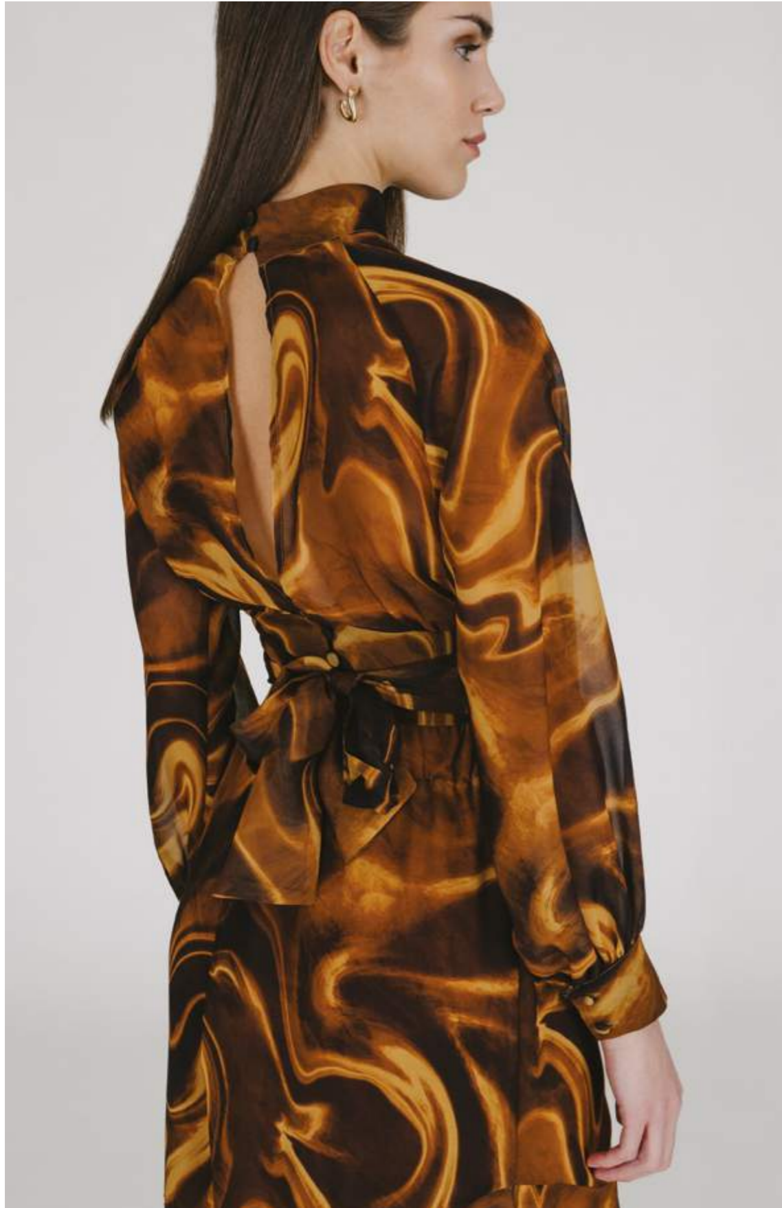
BLUSA - BL 696 GONNA - GN 733