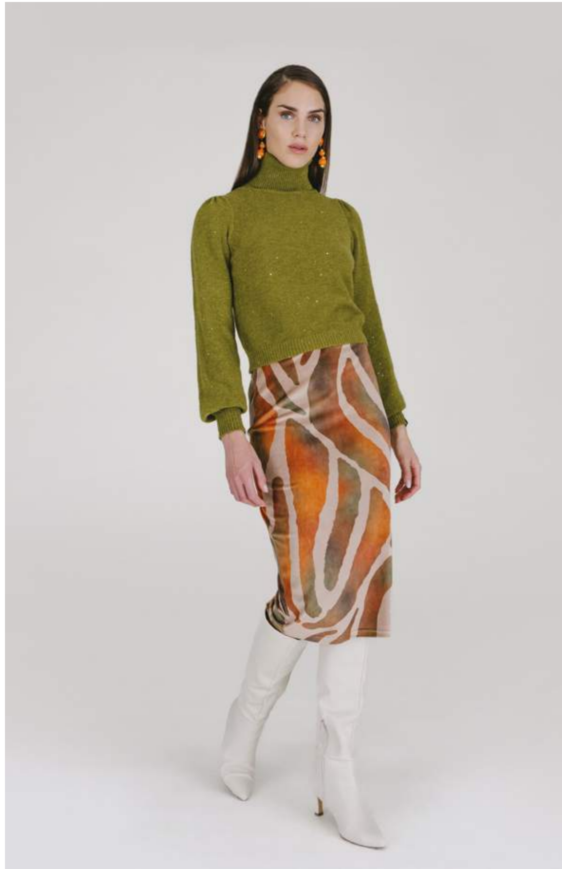
PULLOVER – MLS 342 VERDE COLORI DISPONIBILI: CAMMELLO – NERO – OTTANIO – RUGGINE