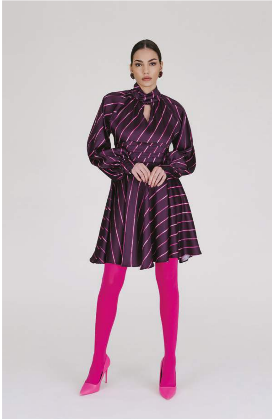
ABITO - AB 1001