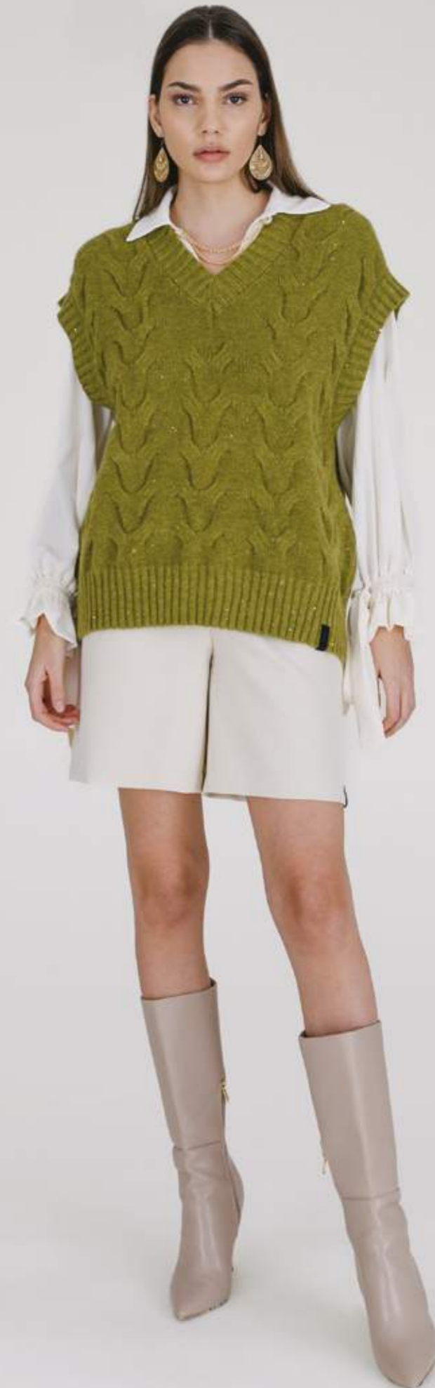
PULLOVER – MLS 341 VERDE COLORI DISPONIBILI: CAMELLO – NERO OTTANIO - RUGGINE