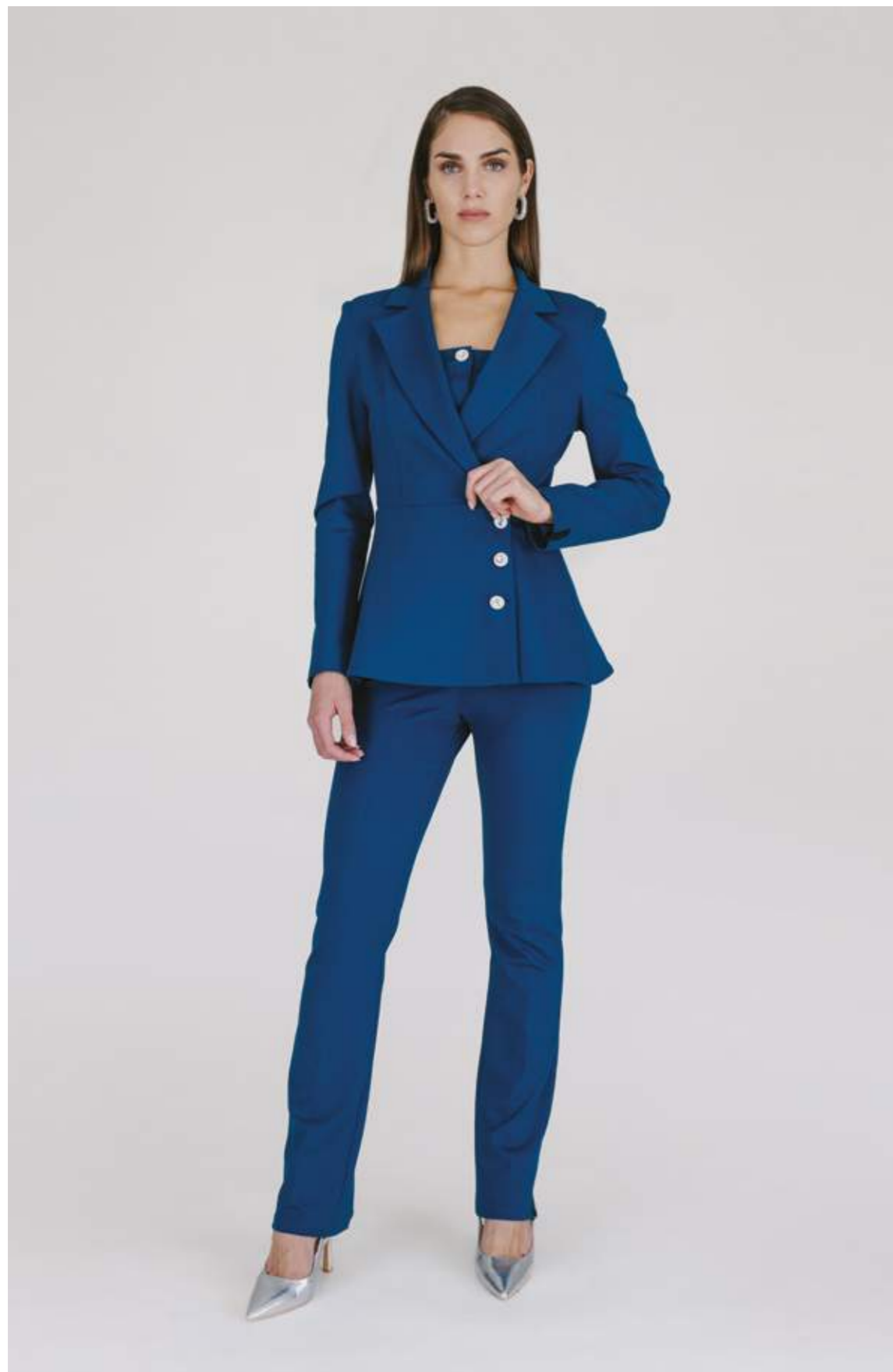
GIACCA – GC 733 OTTANIO COLORI DISPONIBILI: MORO - NERO