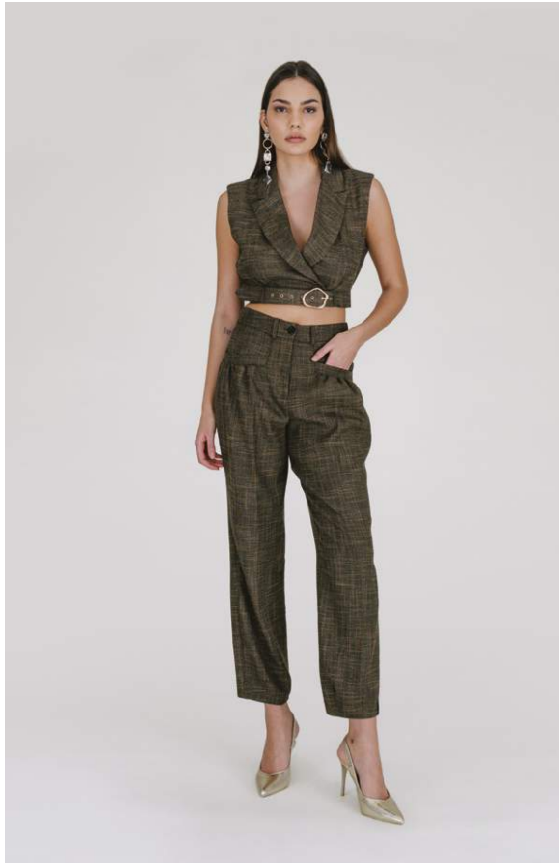
GILET – GL 489 NOCCIOLA COLORI DISPONIBILI: ROYAL