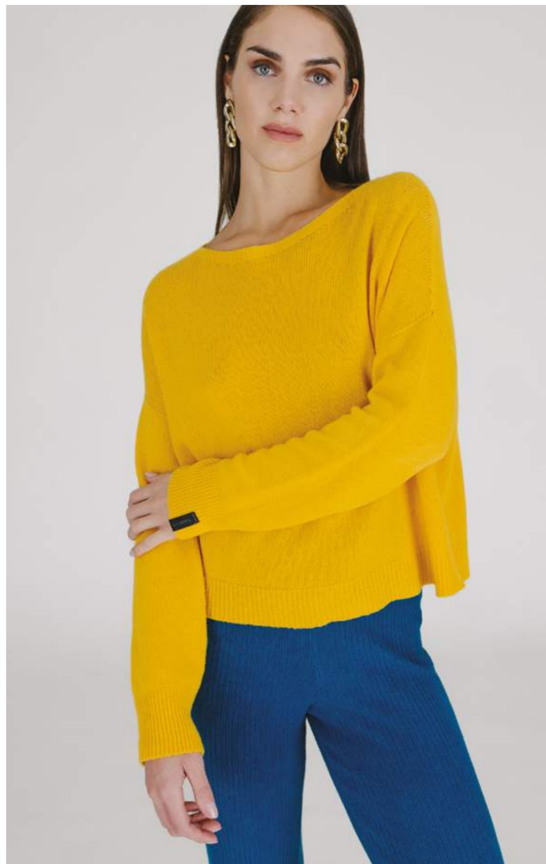
PULLOVER – MLS 336 SENAPE COLORI DISPONIBILI: CAMELLO – NERO – OTTANIO - VERDE