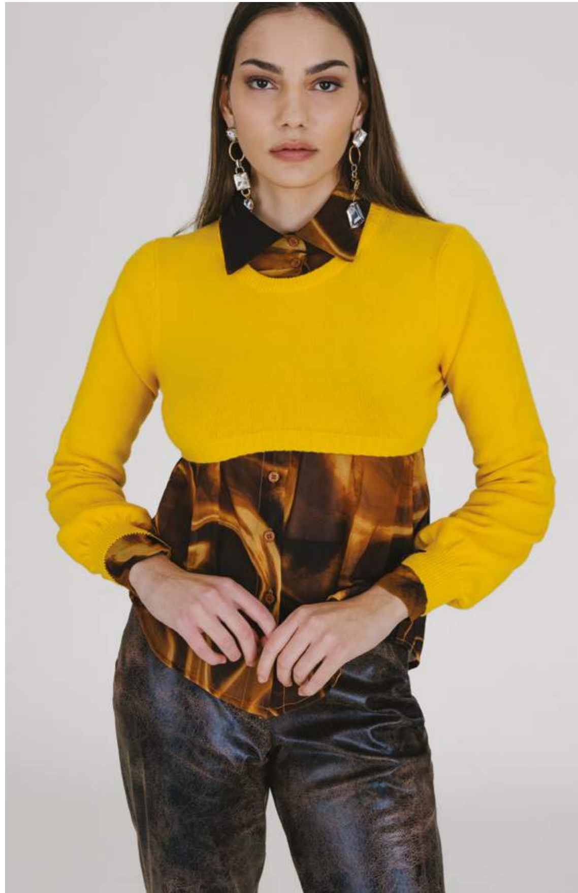
PULLOVER – MLS 339 SENAPE COLORI DISPONIBILI: BRUCIATO – BUBBLE – NERO – PANNA